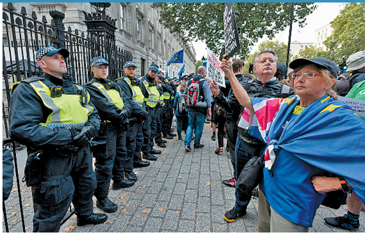
8月28日,一些市民在唐宁街10号首相府外抗议 新华社发

英国首相鲍里斯·约翰逊28日宣布延迟议会复会,日期推后至10月14日,即距离英国脱欧脱离欧盟期限两周。枢密院随后发布声明,说英国女王伊丽莎白二世已经批准这一计划。 约翰逊的举动激怒反对“无协议脱欧”的议员。