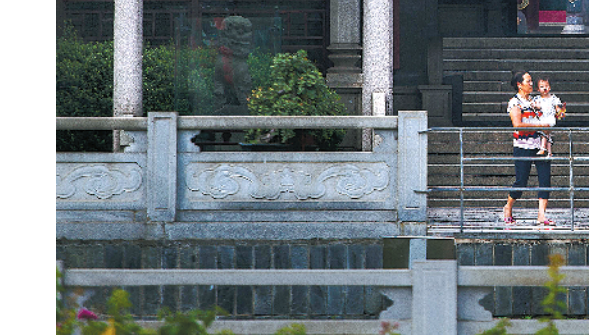
“海不扬波”牌坊