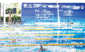
激烈的比赛现场

本次比赛由广东省体育局主办,东莞市文化广电旅游体育局承办,执行单位为广州健朗体育文化传播有限公司。