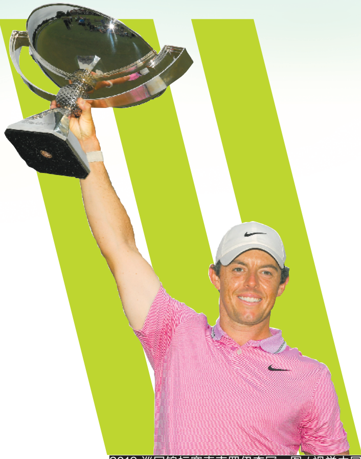
2019巡回锦标赛麦克罗伊夺冠

本赛季赢得三个冠军的,除了麦克罗伊之外,还有在决赛轮打出+2、无缘冠军的科普卡。这是他最近16轮比赛以来第一次出现高于标准杆的单轮成绩。联邦快递杯卫冕冠军贾斯汀·罗斯最终排名并列第26