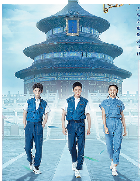
冯绍峰、苗苗、黄明昊变身“实习生”

节目还设有“情景再现”环节,明星嘉宾进行角色扮演,带领观众重返历史。首期节目里,就由冯绍峰饰演的康熙和苗苗饰演的佟佳氏一起,讲述了我国古代音韵十二律之一“黄钟”的来源。据悉,节目后期还将带观众去到天坛目前未对外开放区域,如祈年殿内、皇穹宇殿内等,探访这座古老建筑不为人知的神秘一面。