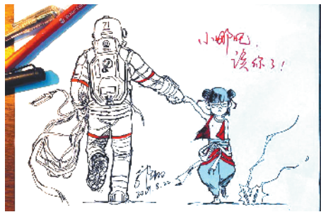
《流浪地球》导演郭帆发图为《哪吒》打气

上映37天以来,影片在海内外均取得了不错的成绩。截至目前,影片成为全球影史单一市场票房最高动画电影,观影人次超1.28亿。影片海外首站创下多项佳绩:在澳大利亚上映首日,该片成功刷新澳大利亚近10年华语电影开画最高票房纪录,首日票房位列全澳同期影片第二,场均上座率超90%。影片已于昨日登陆英国、爱尔兰等院线,9月6日北美全面上映,9月12日新加坡上映。(龚卫锋)