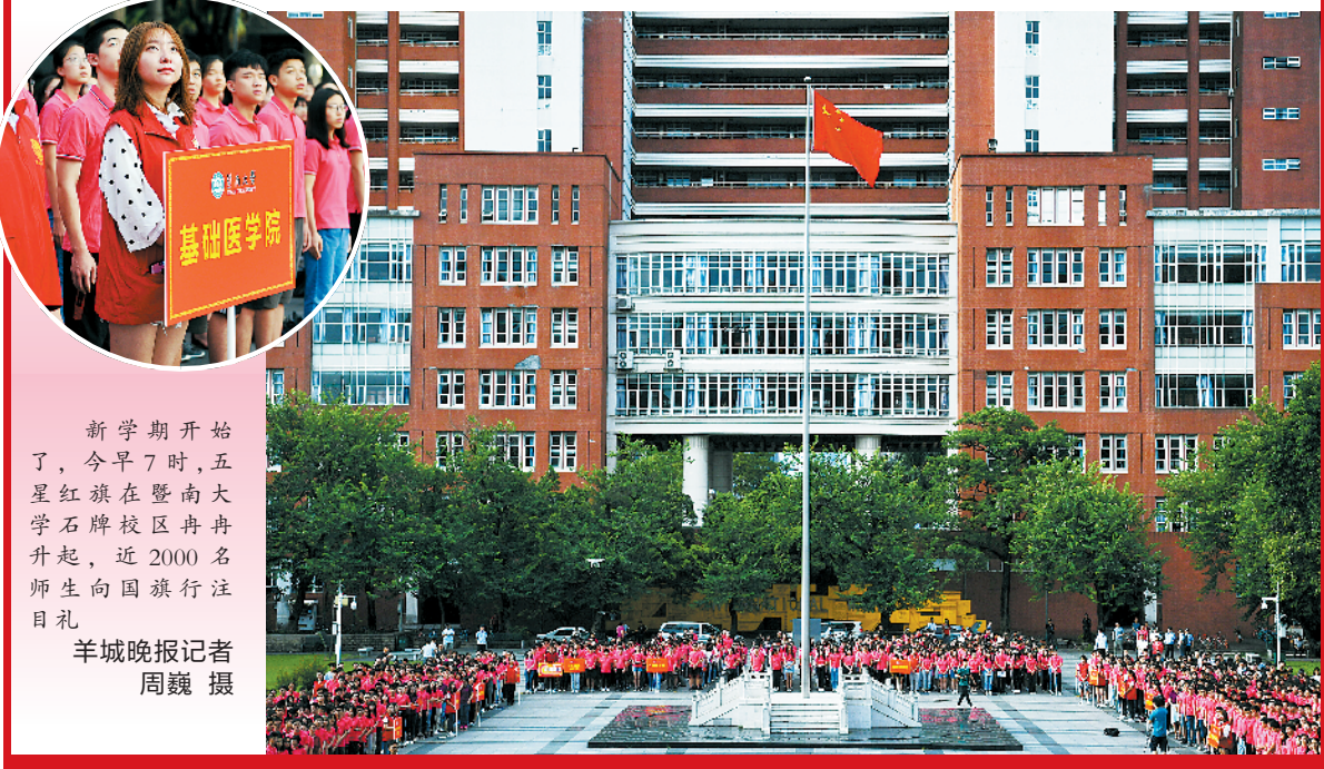
暨南大学举行新学期第一场升旗，近2000名师生向祖国深情表白