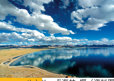
纳木错 卢海林 摄(资料图)