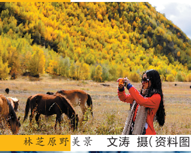
林芝原野美景(资料图)