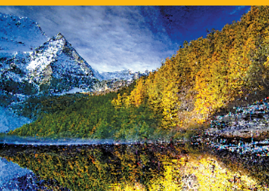
四川西部稻城亚丁珍珠海秋色(资料图)

现在，各大旅行社的赏秋产品也陆续上架，也预示着一年中色彩最丰富的旅游季已经拉开帷幕。初秋，不妨到祖国的北疆、腹地，那里草原和森林、乃至大漠构成的世界，等着我们去邂逅。