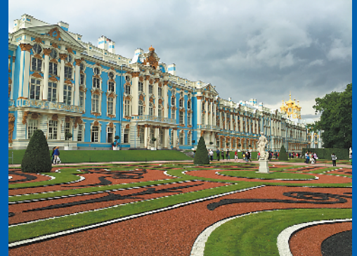
圣彼得堡叶卡捷琳娜宫

而在英国，还可以体验一场皇室金秋之旅——到格林威治公园赏醉美秋色，顺便打卡格林威治皇家天文台。