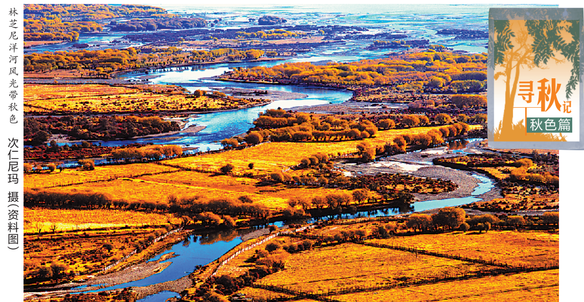
林芝尼洋风光秋色(资料图)