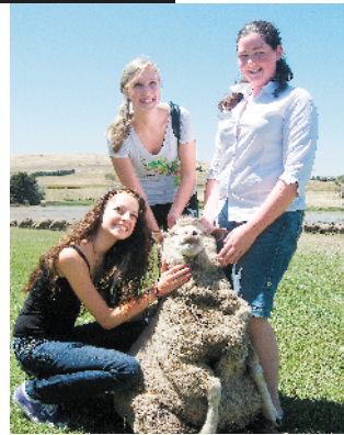
在澳洲亲近动物

此外，当地一些新兴目的地如西澳珀斯、南澳阿德莱德、南部塔斯曼尼亚、北部艾丽斯岩等，都适合寻找特别体验。带小朋友的游客还可以选择带有家庭娱乐色彩的项目，如在酒庄内踩葡萄、出海看海豚、坐小艇游冰川湖、跟着向导观星、乘船夜游峡湾等。