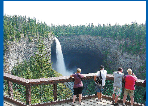
加拿大坎卢普斯秋日风光