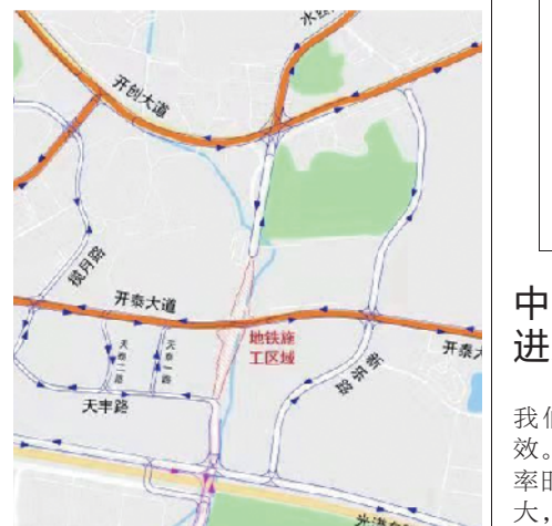
中铁隧道局广州市轨道交通七号线二期六项目经理部 2019年9月4日

施工图纸合理设置交通信号灯、监控、指示牌及标线等交通设施,同时在围蔽两端路口设置交通疏导协管员,配合交警对交通进行疏导,缓解交通压力。过往车辆及行人,请注意现场交通引导人员和交通标志指示安全通行,确保交通安全畅通。