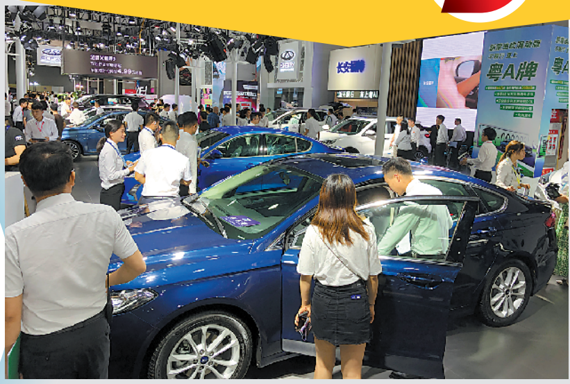
黄金周即将到来,有望掀起购车高潮