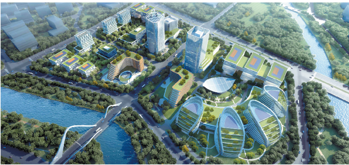
杰赛科技园效果图

众所周知，高科技企业人才对地理环境等要求极高。产业园地理位置优越，与风景优美的花都湖国家湿地公园直线距离仅3公里，且对