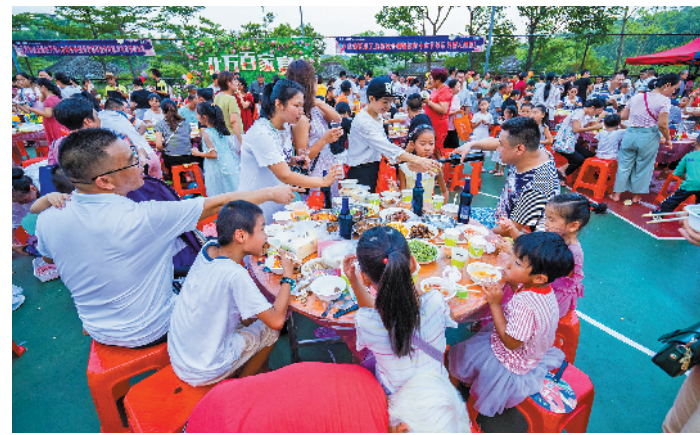
清远北部万科城百家宴