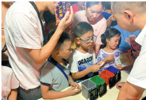
万科柏悦湾宣讲垃圾分类