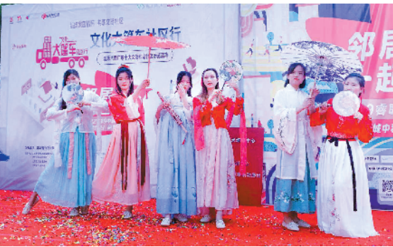
汉服秀为百家宴拉开序幕