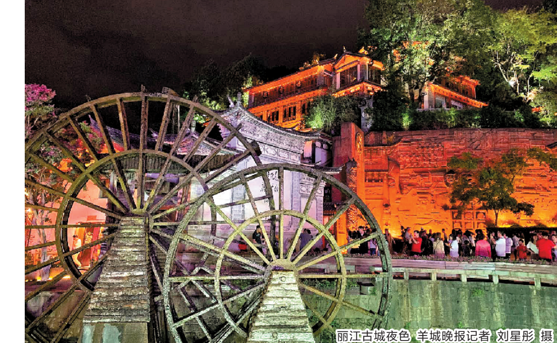
丽江古城夜色

作为国庆黄金周前的欢乐预热，三天的中秋小长假一样的不容错过。今年的中秋之夜，预计有更多的家庭选择外出旅行，在富有新鲜感的异地边游玩边赏月、吃月饼。