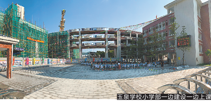
玉泉学校小学部一边建设一边上课

记者9月10日在学校现场看到,学生所在的教学楼旁,另一栋教学楼仍然在建,高高的塔吊悬在该楼上方,而当天早上学生的课间操活动正常进行。“这边已开学,那边还在施工。”有家长看到学校内环境不禁摇了摇头,认为玉泉学校应安排新生到距离小学部不远的玉泉学校老校区上课避免这种争议场景,也有家长认为“一边开工一边开学”最终还是解决了周边居民孩子读书的问题,也是教育部门急家长所急的表现。根据校门口张贴的《致玉泉学校一年级家长信》,承建单位已采用围蔽的方式,将施工区和学校首期使用区完全隔开,保证教学区和建设区互不干扰并排除安全隐患。另一旁的工程概况牌显示,施工工程的竣工日期为2019年12月。