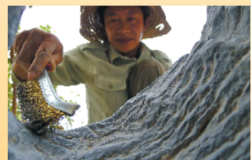
安徽淮北张家林碧奇石文化

磬云山景区为公园主景区,主要有典型岩石、喀斯特地貌、古地震遗迹、白齿构造等特色地质遗迹及御安庙、摩崖石刻等人文景观;其东侧崇山景区,包含典型岩石、白齿构造、溶洞、巨型节理等地质遗迹。两大景区相互连接,地质遗迹互为补充,为游客带来生动的地学科普教材。园内有典型的典型岩石—灵璧石,岩岫奇巧,名列我国四大奇石之首。除了这些珍贵的特色地质遗迹,典型的北方低矮喀斯特地貌、褶皱断层的痕迹、层理地形形成的神奇景观等在园区内广泛分布。