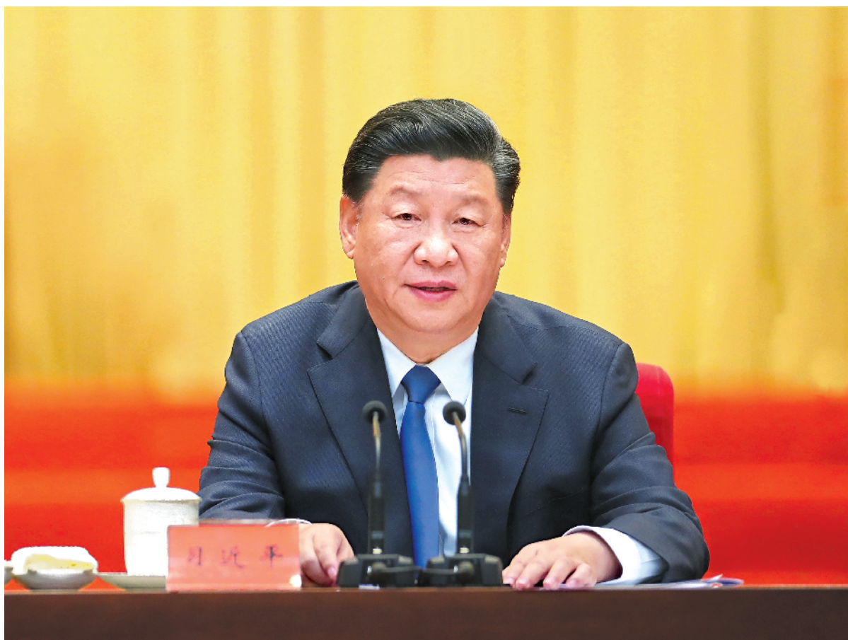
中共中央总书记、国家主席、中央军委主席习近平出席大会并发表重要讲话