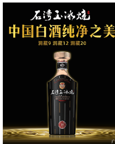
责编/苏碧青 朱帆 美编/伍若龙 校对/温瀚