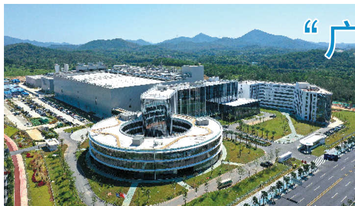
“广州第一芯”诞生在黄埔区

羊城晚报讯 记者张豪、梁悛韬、通讯员黄嘉庆、欧志斌、范敏玲、赖伟敏报道:9月20日,粤芯12英寸晶圆项目在黄埔区、广州开发区投产,这是广州第一条、广东省唯一一条量产的12英寸芯片生产线,标志着“广州第一芯”正式诞生。