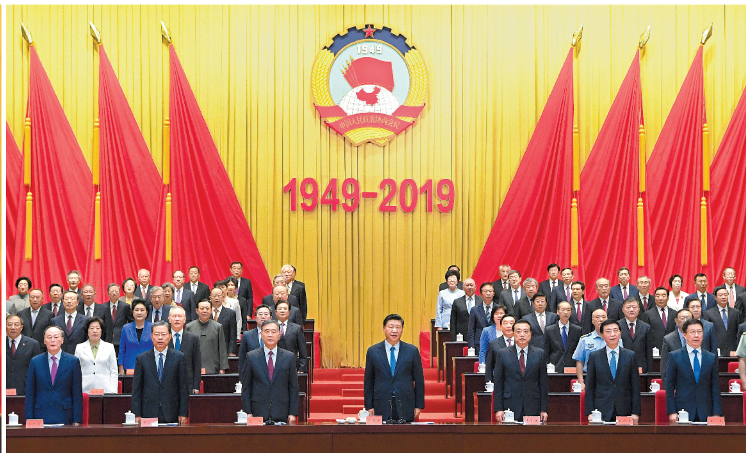
习近平、李克强、汪洋、王沪宁、赵乐际、韩正、王岐山等出席大会 新华社发 详见A2