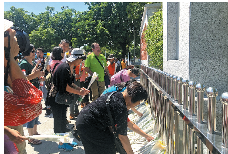
东纵后代和学生们缅怀革命先烈

羊城晚报讯 记者王虹虹摄影报道:在迎接庆祝中华人民共和国成立70周年之际,由羊城晚报报业集团、东莞市委宣传部主办,东莞市委党史研究室、东莞文化广电旅游体育局协办的“重走东纵路、重讲东纵故事”广东(东莞)万里红道主题活动,9月20日上午在东莞行政中心广场启动。