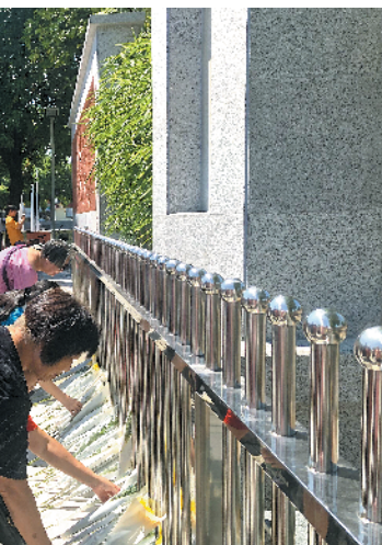
东纵后代和学生们缅怀革命先烈

羊城晚报讯 记者王虹虹摄影报道:在迎接庆祝中华人民共和国成立70周年之际,由羊城晚报报业集团、东莞市委宣传部主办,东莞市委党史研究室、东莞文化广电旅游体育局协办的“重走东纵路、重讲东纵故事”广东(东莞)万里红道主题活动,9月20日上午在东莞行政中心广场启动。