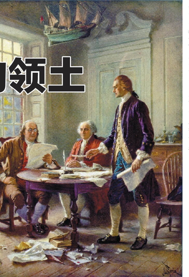
独立宣言起草人由左至右:富兰克林、亚当斯和杰斐逊

由于奴隶制在墨西哥非法,美国移民与墨西哥政府冲突不断。1836年3月2日,德克萨斯移民宣布独立,成立德克萨斯共和国。1845年12月29日,面积70万平方公里的德克萨斯正式加入合众国,成为美国的一个州。但墨西哥和国际社会对美国的兼并不承认。