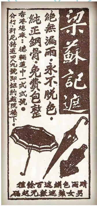
“梁苏记遮”在报纸上刊登的广告

比价钱就是梁苏记的伞比别家的贵,别人卖五元一把,他卖八元。因为钢骨遮本来就是高档商品,价钱贵让顾客产生“这才是高档货”的感觉;比质量就是梁苏记