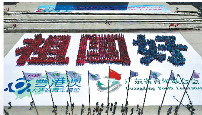
粤港澳青年快闪拼出“祖国好”

据悉，该活动由广东省青年联合会、粤港澳大湾区青年总会主办。此次来自粤港澳三地的青年代表不仅感受了佛山、江门、广州三地古迹名胜、特色建筑、传统工艺等特色文化，并且通过大合唱、摆拼“祖国好”阵型等集体交流活动为祖国的明天献上了美好祝福，增强了彼此的认同感。