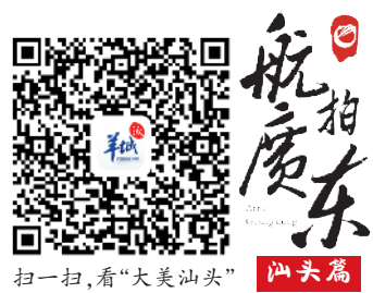
扫一扫，看“大美汕头” 汕头篇

汕头是著名侨乡，昔年潮汕先民乘坐红头船漂洋出海，赴海外艰苦创业，成就了诸多南洋巨