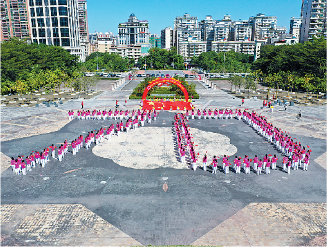
博罗县广场舞舞协第三届展演活动中,舞者在东山森林公园北广场摆出70字样,为新中国庆生日