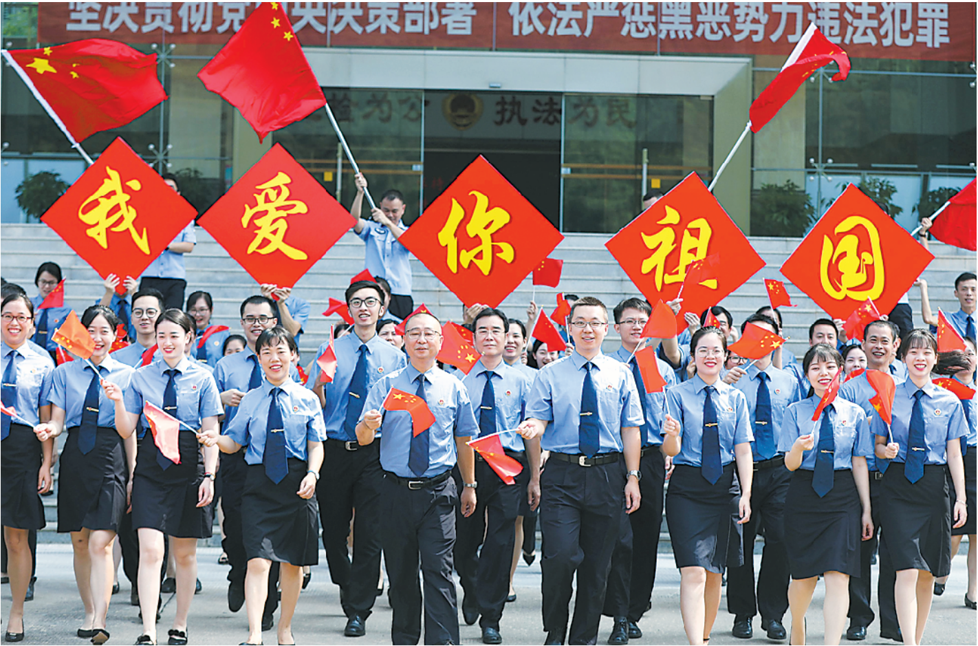
惠州市惠城区人民检察院组织干警开展“礼赞祖国,深情告白”主题快闪活动