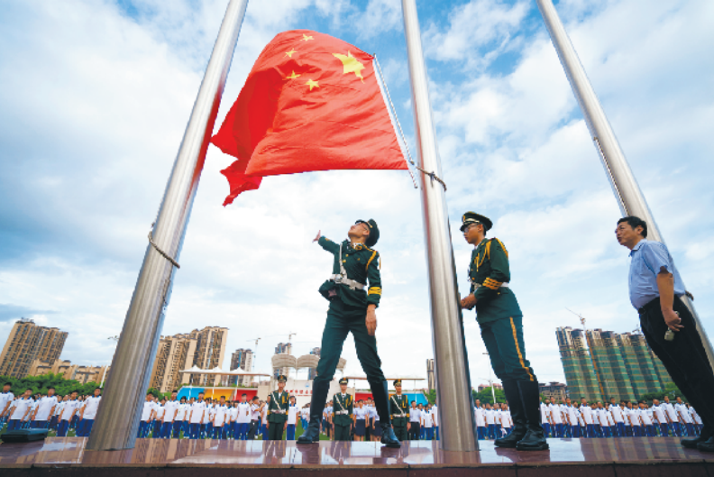
惠州市综合高中举行“我为祖国升国旗”主题教育活动