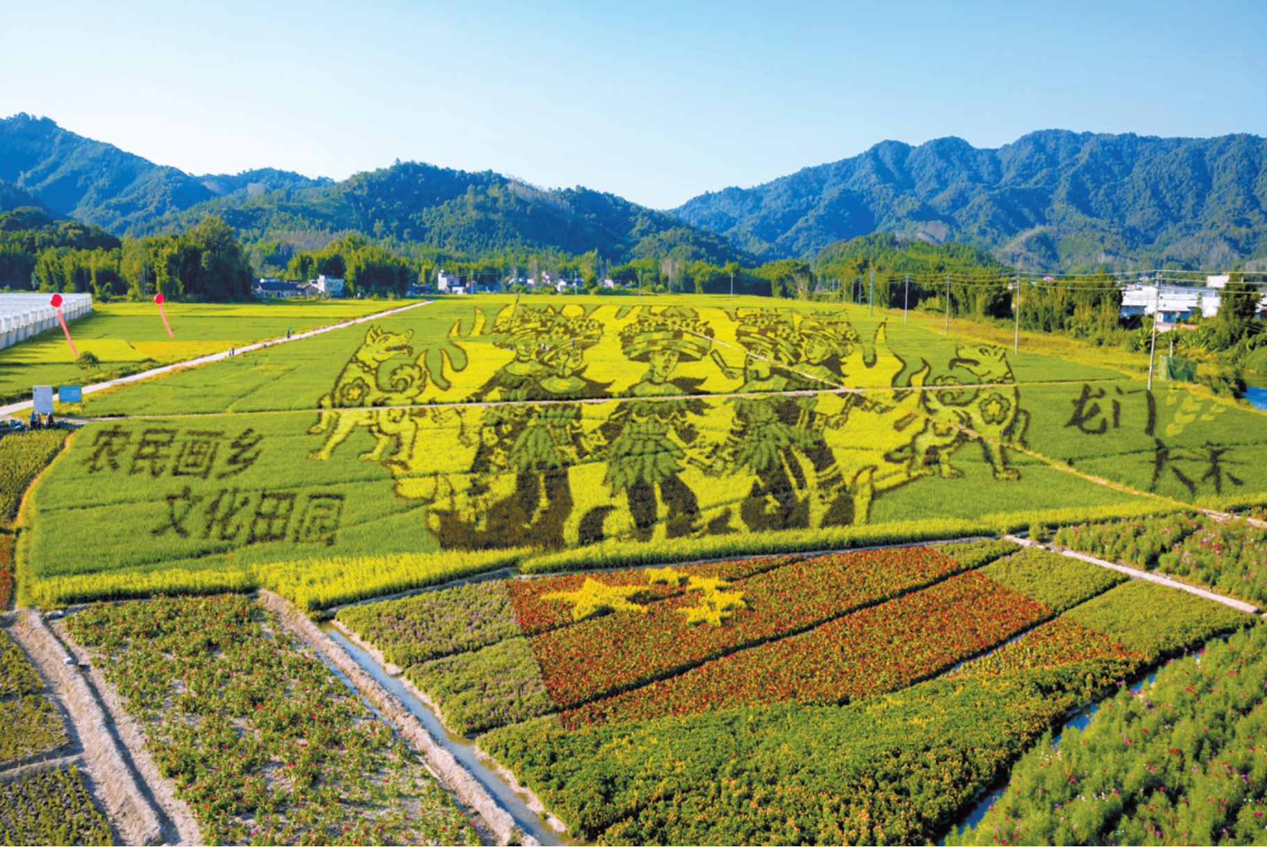
庆祝“中国农民丰收节”,龙门县的“百亩稻田龙门农民画”在田地间用水稻和鲜花摆出国旗造型