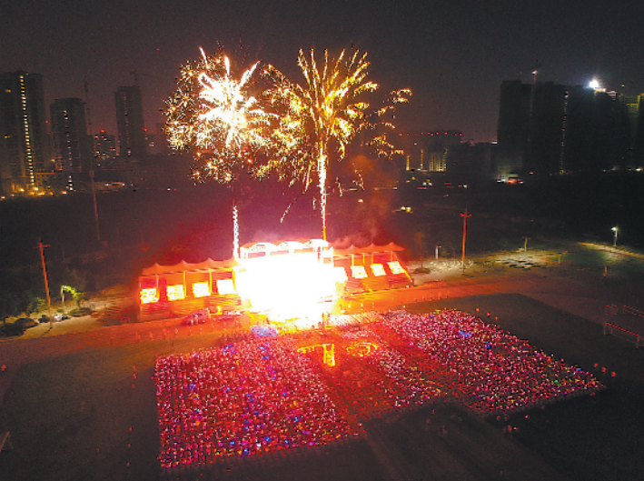
惠州市综合高中在“歌唱祖国,筑梦青春”庆祝活动中放烟花