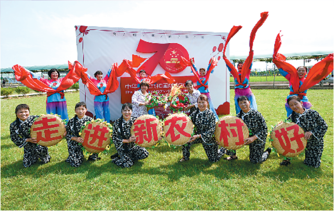
惠州市惠城区“中国农民丰收节”活动一景