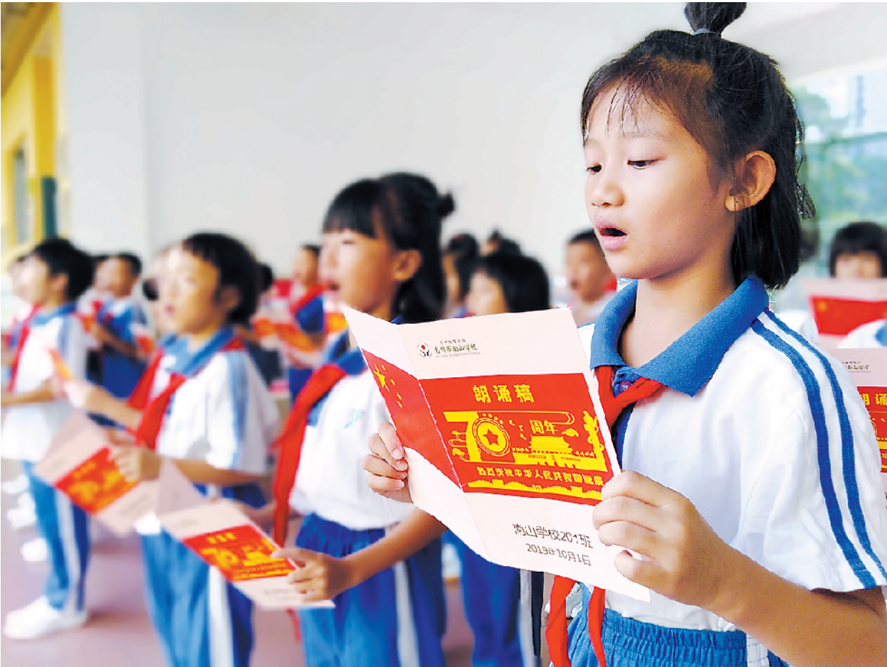
惠州市南山学校的孩子们正在为国庆节举行的诗歌朗诵会进行排练