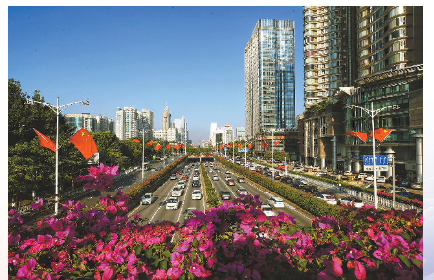
国庆节临近，佛山街头五星红旗迎风飘扬