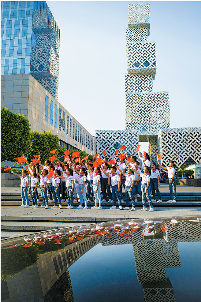
佛山新城坊塔下，一群挥舞着国旗的孩子，正在录制为国庆献礼的合唱视频