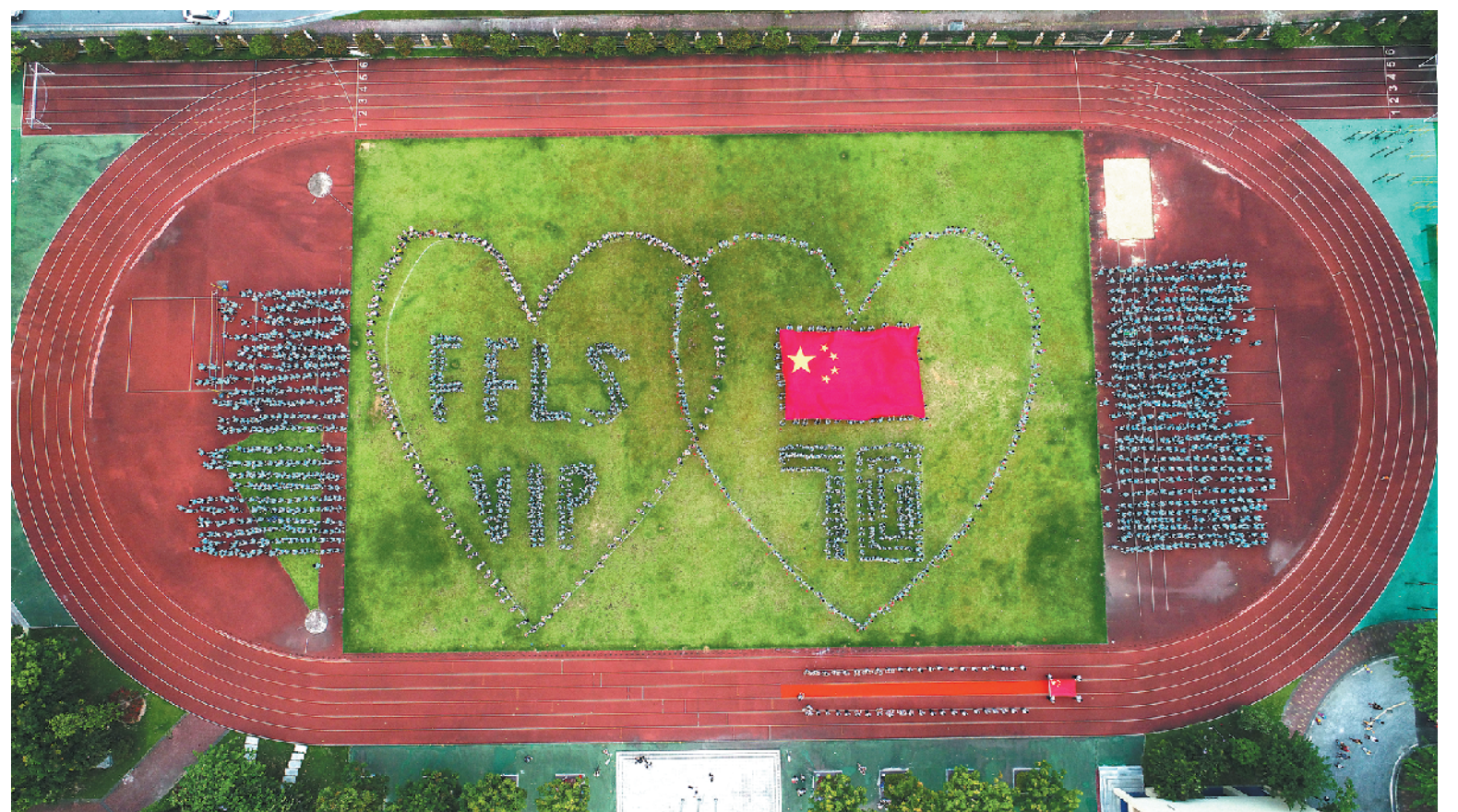
禅城南庄，佛山外国语学校师生举行庆祝新中国成立70周年快闪活动