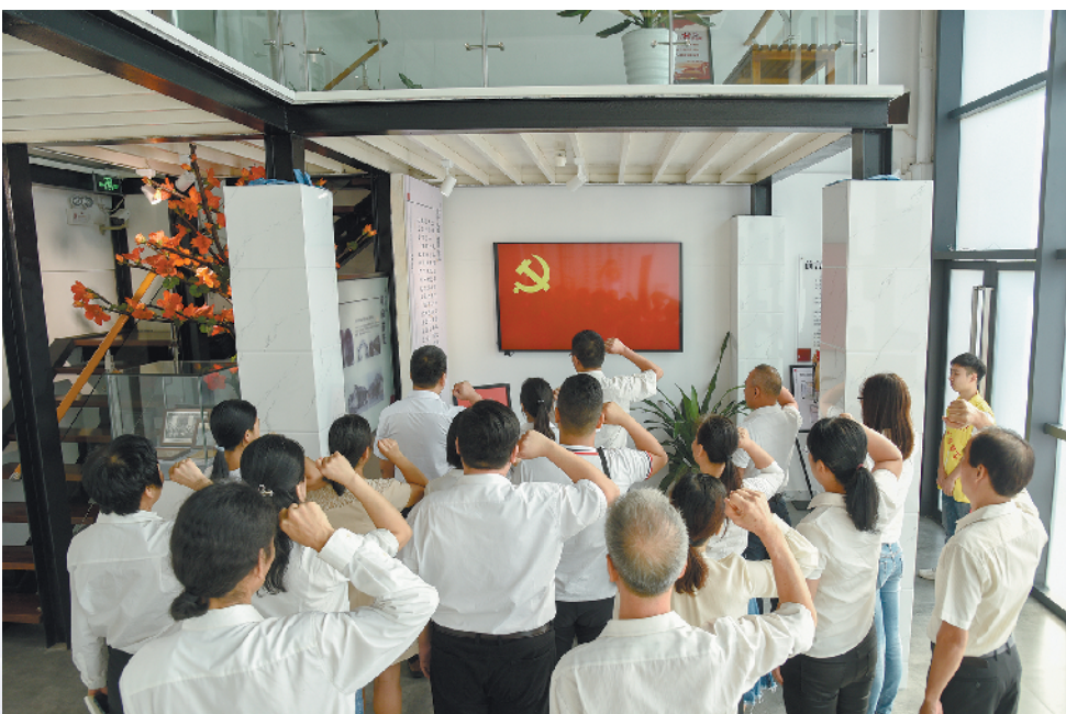
国庆前，大沥文化站全体党员参观大沥革命烈士纪念馆