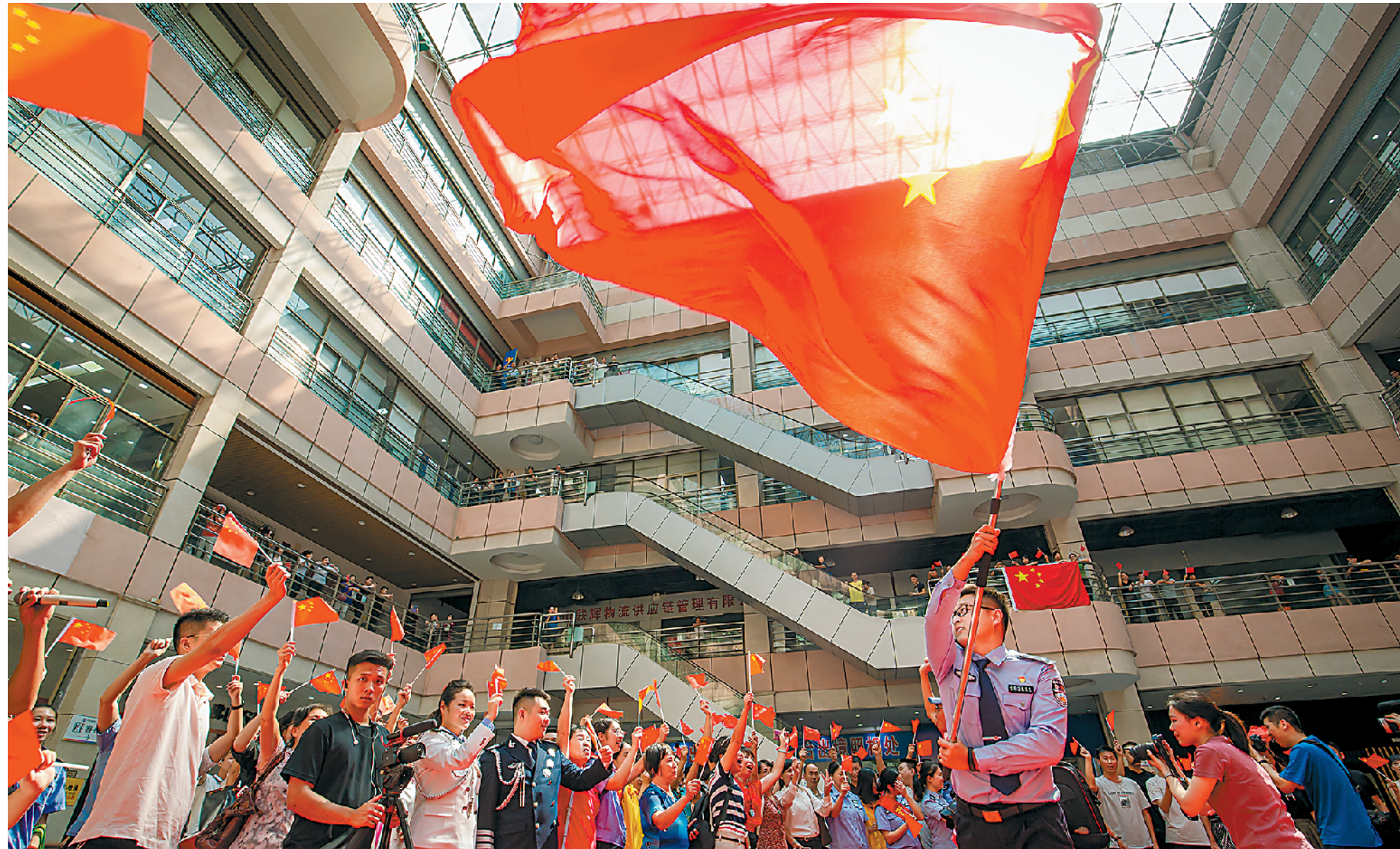
节前，禅城公安举行文艺快闪秀，以警民合唱的方式向伟大祖国深情告白