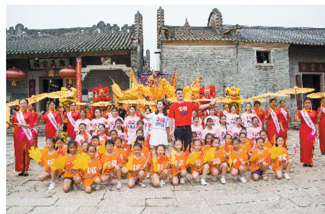
三水乡村振兴秋色嘉年华爱国主题快闪活动，日前在大旗头古村麻石广场举行