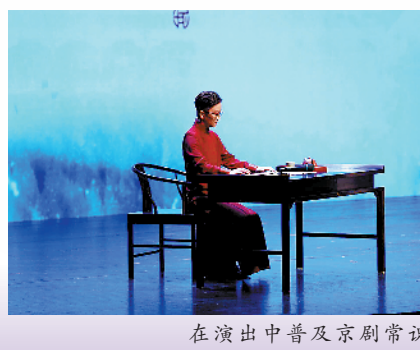
在演出中普及京剧常识

对于这些称号，她也有跳出自己身份的审视：“京剧一脉相承的传统，当别人还愿意这样叫你的时候，说明某些方面你做得好，但是你总有一天要从‘学别人’到‘做自己’。”