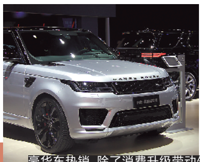
豪华车热销,除了消费升级带动外,也得益于价格的进一步下降

中汽协日前公布的数据显示,1月-8月,国内汽车产销分别完成1593.9万辆和1610.4万辆,产销量比上年同期分别下降12.1%和11%,产销量降幅比1月-7月分别收窄1.4和0.4个百分点。总体上看,整体产销同比仍有双位数跌幅。来自乘联会的数据则显示,豪华品牌零售同比去年