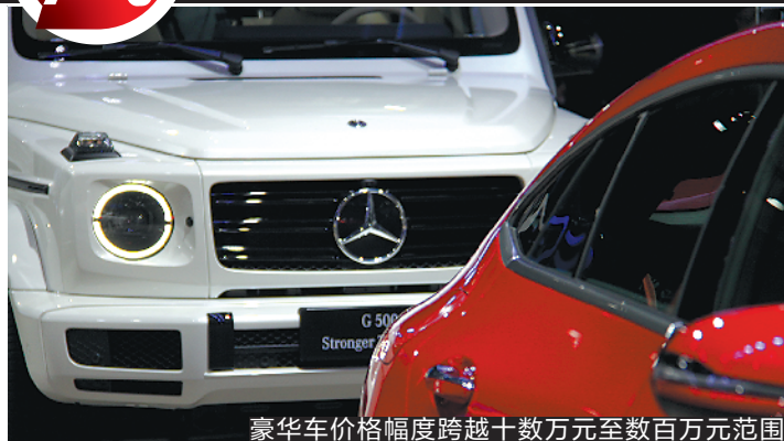
豪华车价格幅度跨越数十万元至数百万元范围