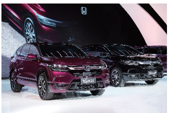
搭载了 SPORT HYBRID 和 SPORT TURBO 系统

车尾尾部与前脸设计相互呼应，配合扁平式 L 型尾灯，更凸显车身宽大、厚实、有力量感。此外，在发布活动现场，率先亮相的车型采用 19 寸铝轮毂，车身颜色分别为奥夫特黑和罗曼紫。奥夫特黑，大气、硬朗且有质感；罗曼紫，时尚、高贵又富有神秘色彩。个性车色，