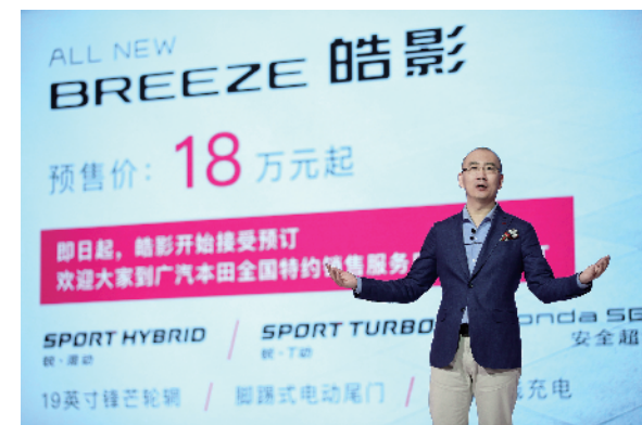
广汽本田全新 SUV 皓影 BREEZE 预售价 18 万元起

WHAT IS NEXT BEAUTY? 从皓影 BREEZE 以“本色之美”引领 SUV 设计美学中，我们找到了新标准；也从皓影 BREEZE 以“本色实力”引领消费升级趋势中，寻觅到了新谜底。