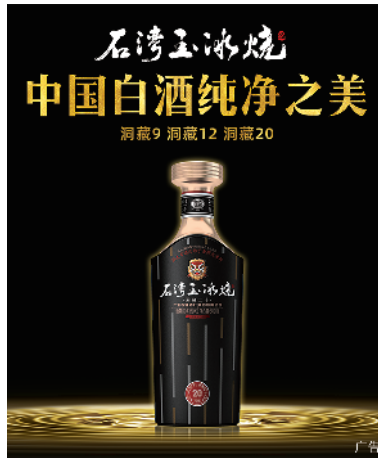
责编/袁婧 林丽爱 美编/蔡红 校对/潘丽玲