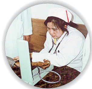
“我们心中永远盛开的玉兰”

叶欣是广东省湛江市徐闻县人，1956年出生，1972年参加工作，生前系广东省中医院二沙岛医院急诊科护士长，中共党员。英雄叶欣荣获白求恩奖章、南丁格尔奖章，被授予“革命烈士”称号，被评为“100位新中国成立以来感动中国人物”。“大医精诚”正是叶欣一生光辉的写照。