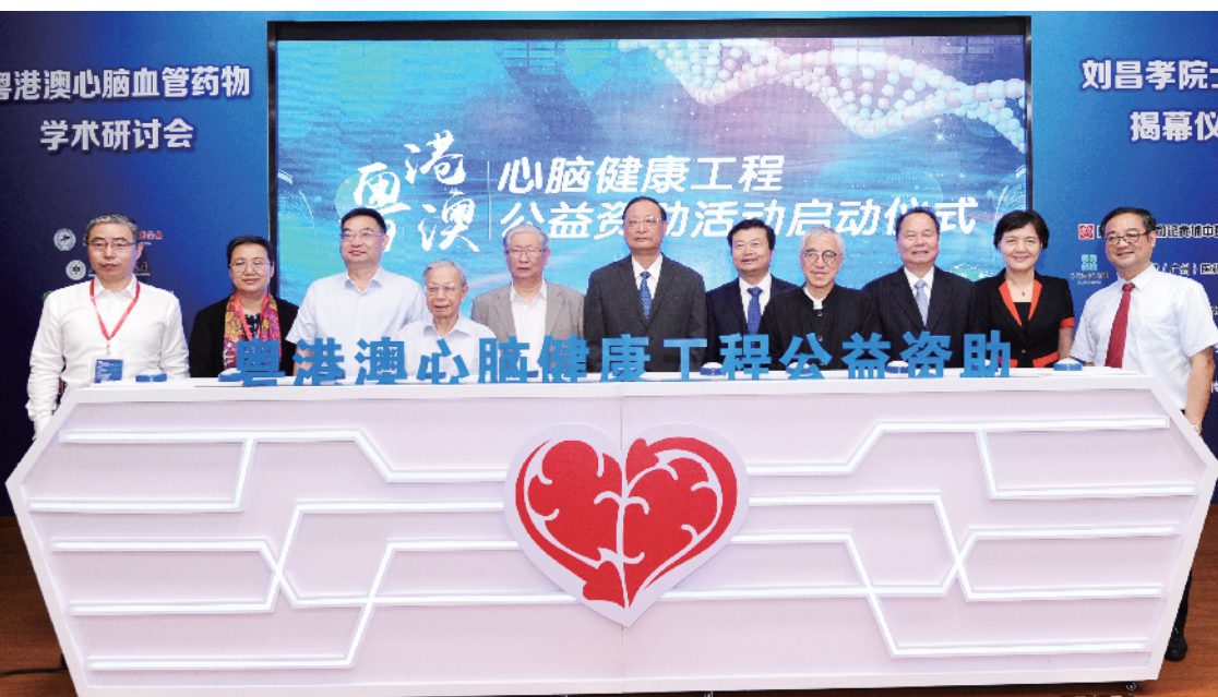
粤港澳心脑血管健康工程公益资助活动启动仪式

失能老年人大多数是慢病引起的,心脏病、脑血管病、恶性肿瘤排名前三,另外还有呼吸病、代谢病等其他疾病,因此白云山和黄中药在这些疾病的防治方面有很多举措。文/陈泽云