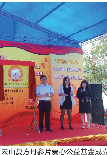
白云山复方丹参片爱心公益基金成立

近日,依托白云山复方丹参片爱心公益基金为背景的粤港澳心脑血管健康工程公益资助活动正式启动。截至目前,白云山和黄中药已在全国范围内联合全国多家百强医药连锁共建“防治老年痴呆健康之家”100家,志愿者服务队已在全国开展3000场社区健康讲堂,1000场爱心公益活动。