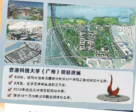
香港科技大学(广州)昨日正式动工建设

香港科技大学(广州)项目进展 8月8日，港科大港大集团设计团队KPF开始启动设计工作。 8月底，港大港大集团启动前期设计工作。 2019年底完成前期设计工作。 预计18个月内完成前期设计工作。