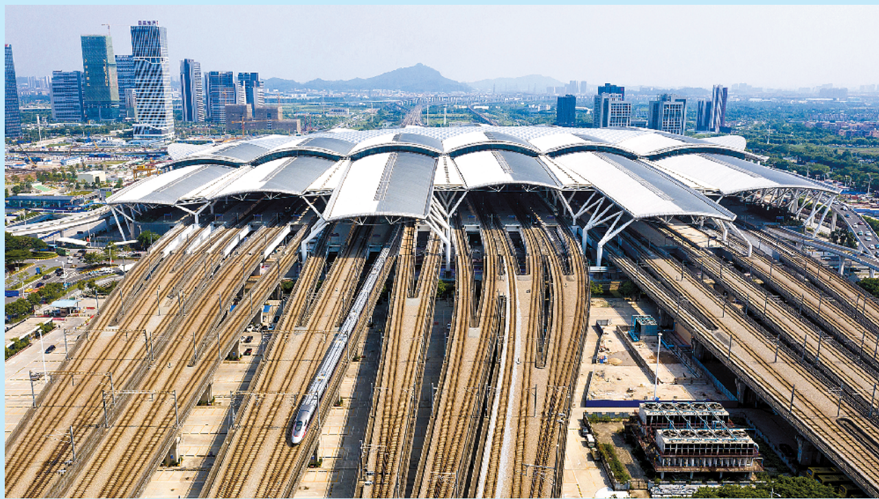
列车从广州南站驶出

从务实、敢闯,到自由、开放,再到创新、宜居,广州正变轴换挡,向海入湾,向全球释放高质量发展“引力波”,加速开启建设综合性国际化大都市的新航程。