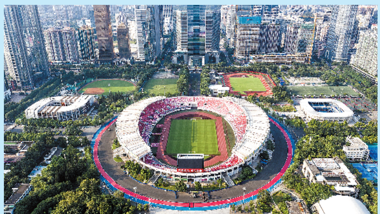
闻名全国的天河商圈