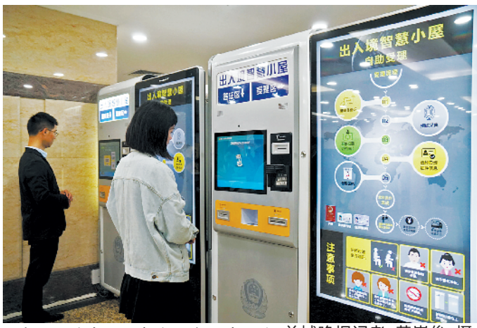
市民通过自助设备办理出入境证件