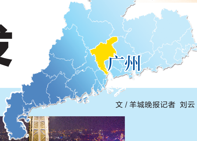
文/羊城晚报记者 刘云

作为广东省省会,广州是华南地区经济、科教和文化中心,也是国务院颁布的全国第一批历史文化名城之一。