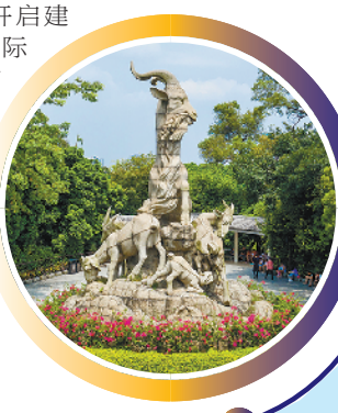
五羊石像造型优美,是广州城市的标志