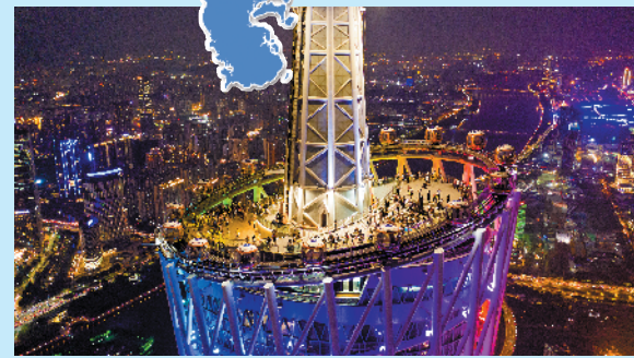
广州塔顶端有世界最高的摩天轮