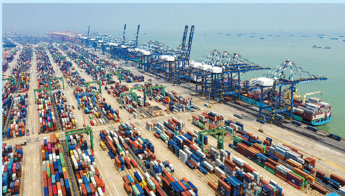
南沙港是连接珠三角两岸城市群的枢纽性节点