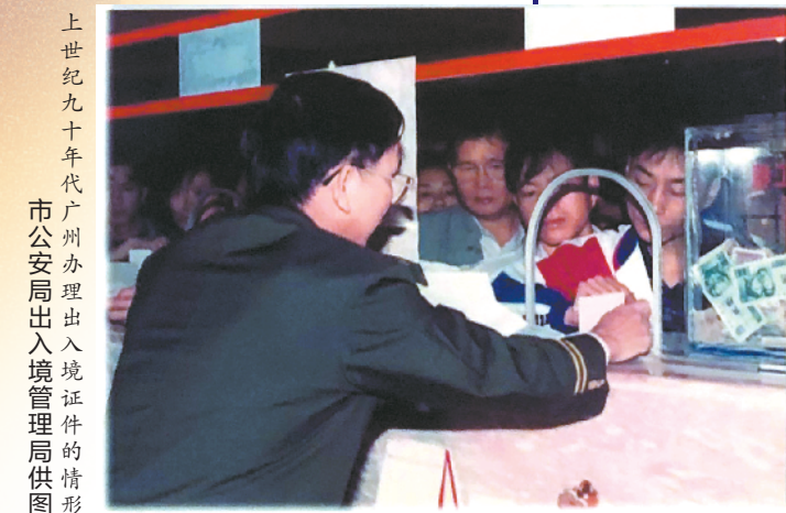
上世纪九十年代广州公安局出入境管理科的情况