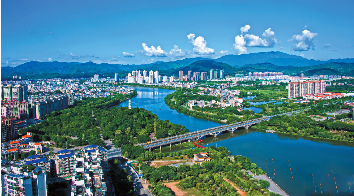
美丽的曾江