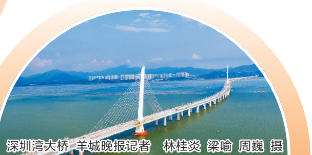
深圳湾大桥