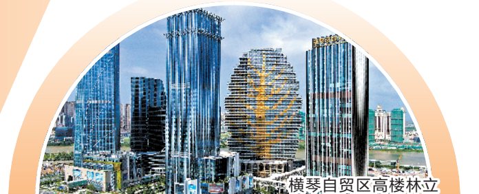
横琴自贸区高楼林立

中国劳动和社会保障科学研究院医保研究室主任王宗凡认为,澳门本地的医保制度不能覆盖在内地就医的费用,常住珠海的澳门人如果参加珠海医保,就可以免去因就医而回澳门的麻烦。其次,全国异地就医医保系统已建立,常住珠海的澳门人在珠海参保,意味着可以全国范围内办理异地住院,享受刷卡直接结算,这对于频繁在内地城市流动的澳门居民具有重要意义。其三,澳门的医疗资源相对短缺,尤其是高新医疗资源不如广州等内地大城市充裕,参加珠海基本医疗保险有助于缓解澳门医疗资源短缺问题。他坦言,该政策是对国家支持在内地居住港澳居民依法参加社会保险决策的具体探索和落实,对于便利澳门居民在内地发展,促进粤港澳大湾区经济一体化、支持港澳地区融入国家发展大局具有重要意义。