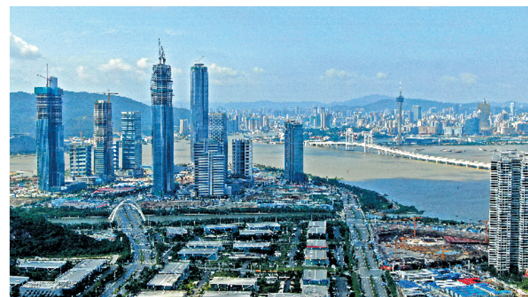
横琴自贸区毗邻澳门

横琴对澳产业合作的前景令人期待。据介绍,粤澳合作产业园余下的2.57平方公里土地将以澳门为主导,实施新的项目评审机制。目前澳门贸促局已收集到的人园项目申请超过70个,正处于路演评审阶段。横琴已率先实施“港人港税、澳人澳税”政策,实现港澳居民实际个税税负与港澳基本持平,目前已合计补助约1亿元。另外,横琴在“澳人澳税”的基础上,正进一步争取“澳企澳税”的政策。