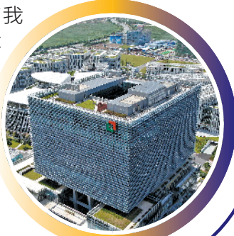
粤澳中医药合作产业园