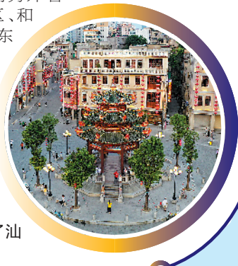
小公园见证了汕头埠商业繁华史