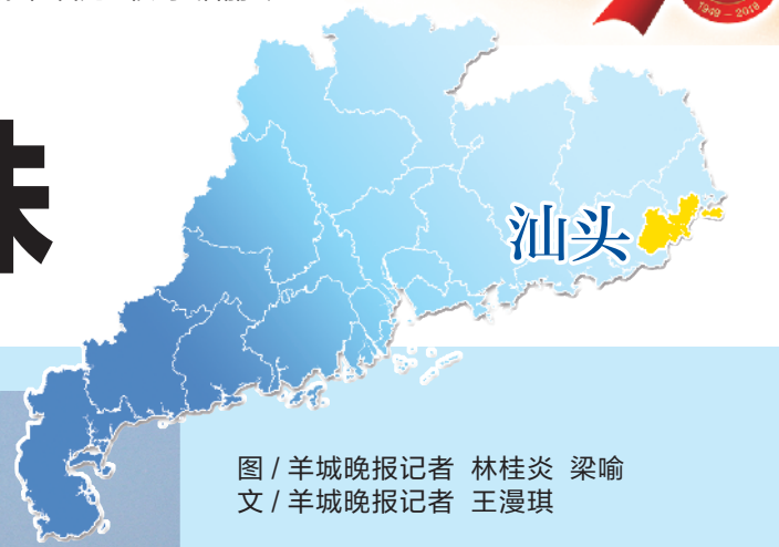
文 / 羊城晚报记者 王漫琪

汕头地处韩江、榕江、练江三江入海口，由一方渔村兴起，到1860年成为中国首批通商口岸之一，上世纪30年代，汕头港外洋船进出港艘次与吨位数居全国第三位，呈现“樯橹如林，商贾似云”的百载商埠盛景。