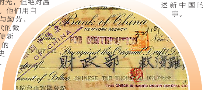
纽约台山华侨救国后援会