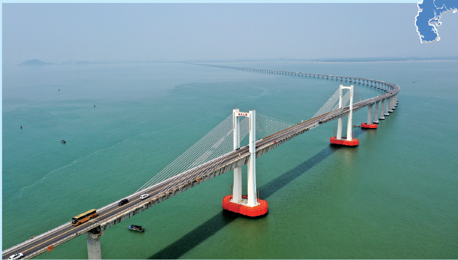
南澳大桥宏伟壮观

从“百载商埠”到国家首批经济特区之一，汕头的侨乡血脉、潮商基因始终根植于这片滨海热土。融湾建带正当时，今日汕头正全力建设省域副中心城市，打造内秀外美的活力特区、和美侨乡、粤东明珠。