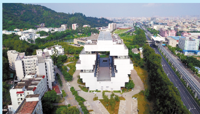
汕头大学位于桑浦山下