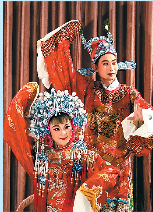
潮剧是一个古老的地方戏曲剧种