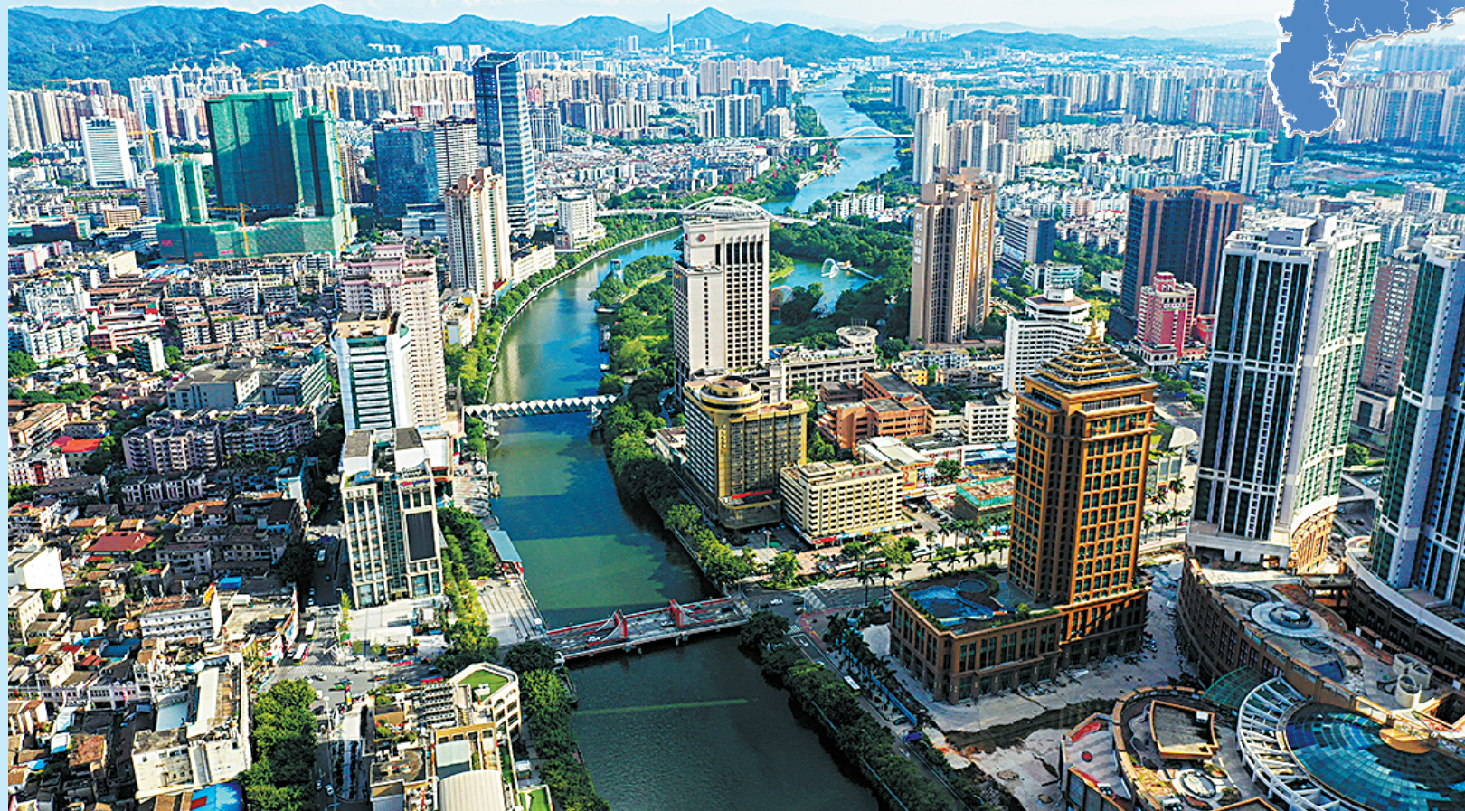
一江两岸风光秀美

百舸争流，奋楫者先。深中通道的建设正如火如荼，作为粤港澳大湾区的重要节点城市，中山市以广深港高层次合作为基础打造国际合作创新区，以改革创新的精神高水平打造国际一流湾区城市，奋力建设珠江东西两岸融合发展支撑点、沿海经济带枢纽城市、粤港澳大湾区重要一极。