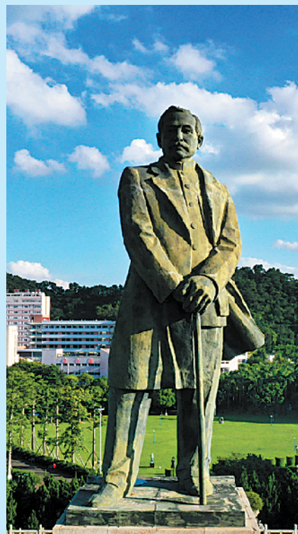
孙文纪念公园孙中山像