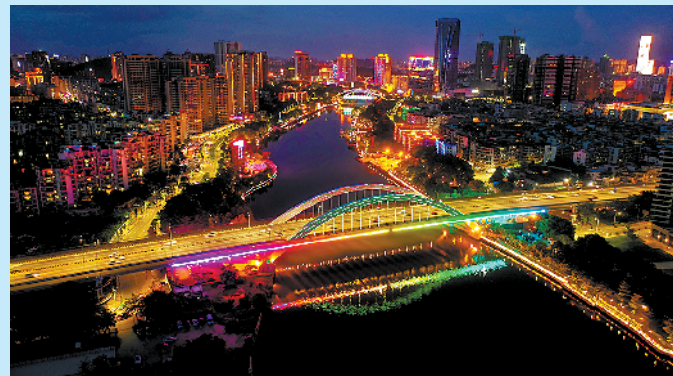
中山二桥夜景绚丽动人