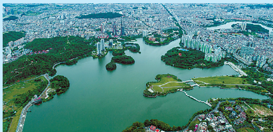
鸳鸯湖公园是山岳湖泊相结合的自然景区