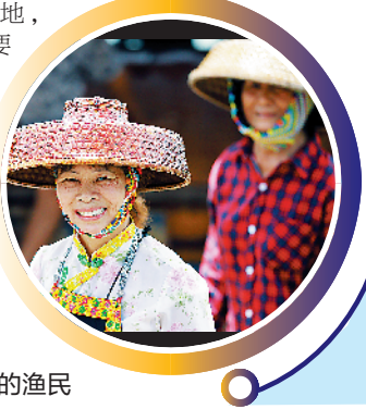
溪头渔港唱咸水歌的渔民