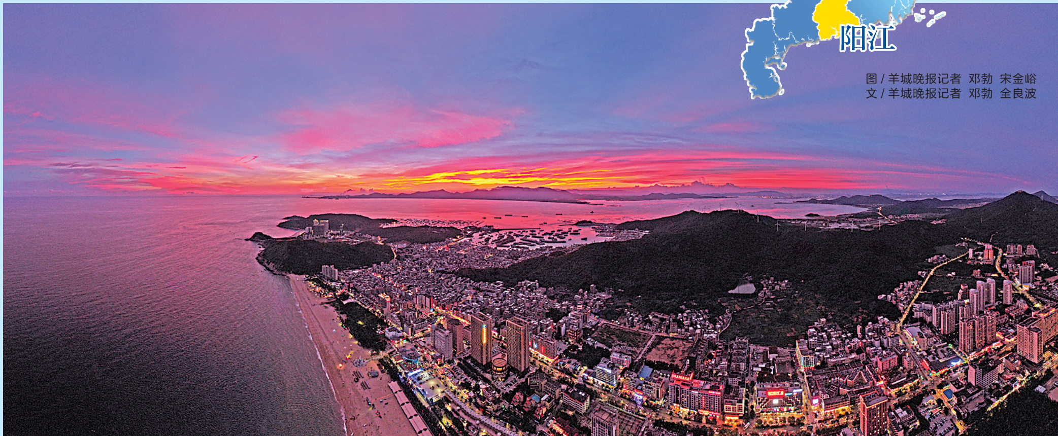
海陵岛是中国十大最美海岛之一

“以海兴市，绿色发展”，阳江正积极融入粤港澳大湾区建设，全力打造千亿级合金材料产业集群和世界级风电产业基地，打造大湾区重要休闲旅游目的地，充分发挥沿海经济带重要战略支点的支撑作用，在全面深入改革开放的新征途中奏响新乐章。