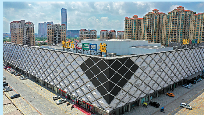
古镇光立方 LED 城，现代科技味浓郁