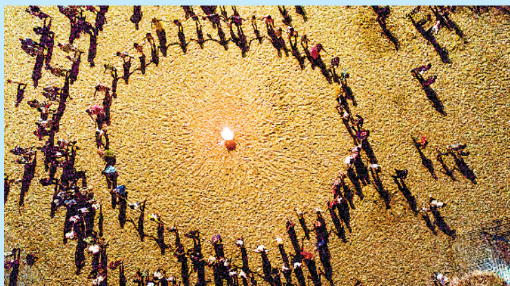
大角湾以阳光、沙滩、海浪、海鲜闻名