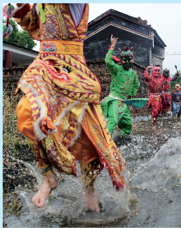
雷州市松竹镇仙排村的傩舞