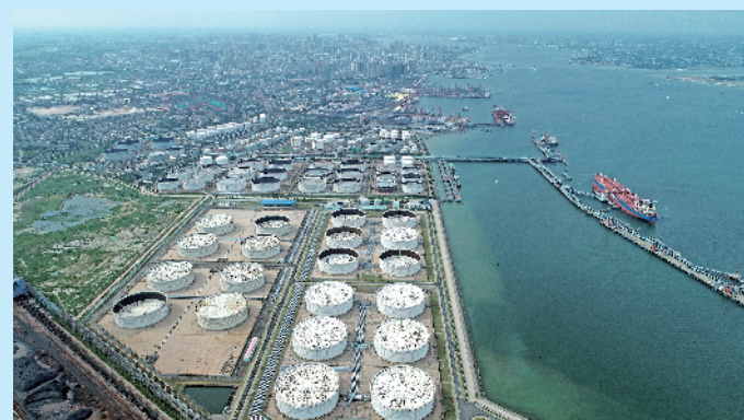
湛江港是粤西和环北部湾最大的天然深水良港