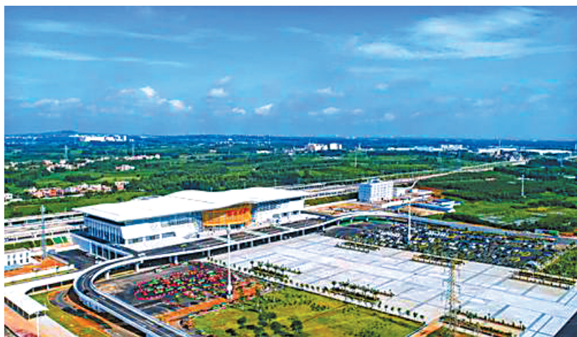
湛江西站拔地而起