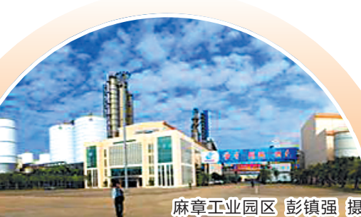
麻章工业园区

2018年，全区有高新企业23家，完成产值的103.9亿元，占全区规上工业总产值的85.3%，今年预计新增高新企业5家。同时，麻章着力推进科技创新，加快推进湛江海洋产业创新中心建设，目前已有44家科技企业入驻，共组织企业申报立项省科技计划项目11项。2018年，获得湛江市科技考核一等奖。麻章人给自己描绘的蓝图是：争取在3到5年内，成为湛江市发展速度最快、投资环境最佳、经济内在素质最好的地区之一。