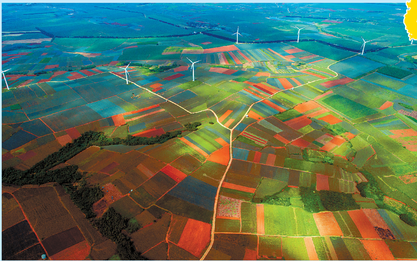
闻名遐迩的“菠萝的海”在红土地上飘香