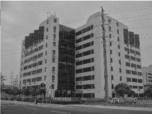
创意园1号楼改造前的画面