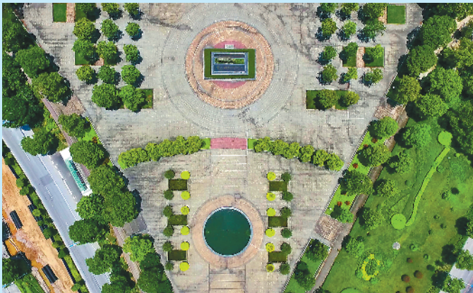
肇庆国家高新区一景