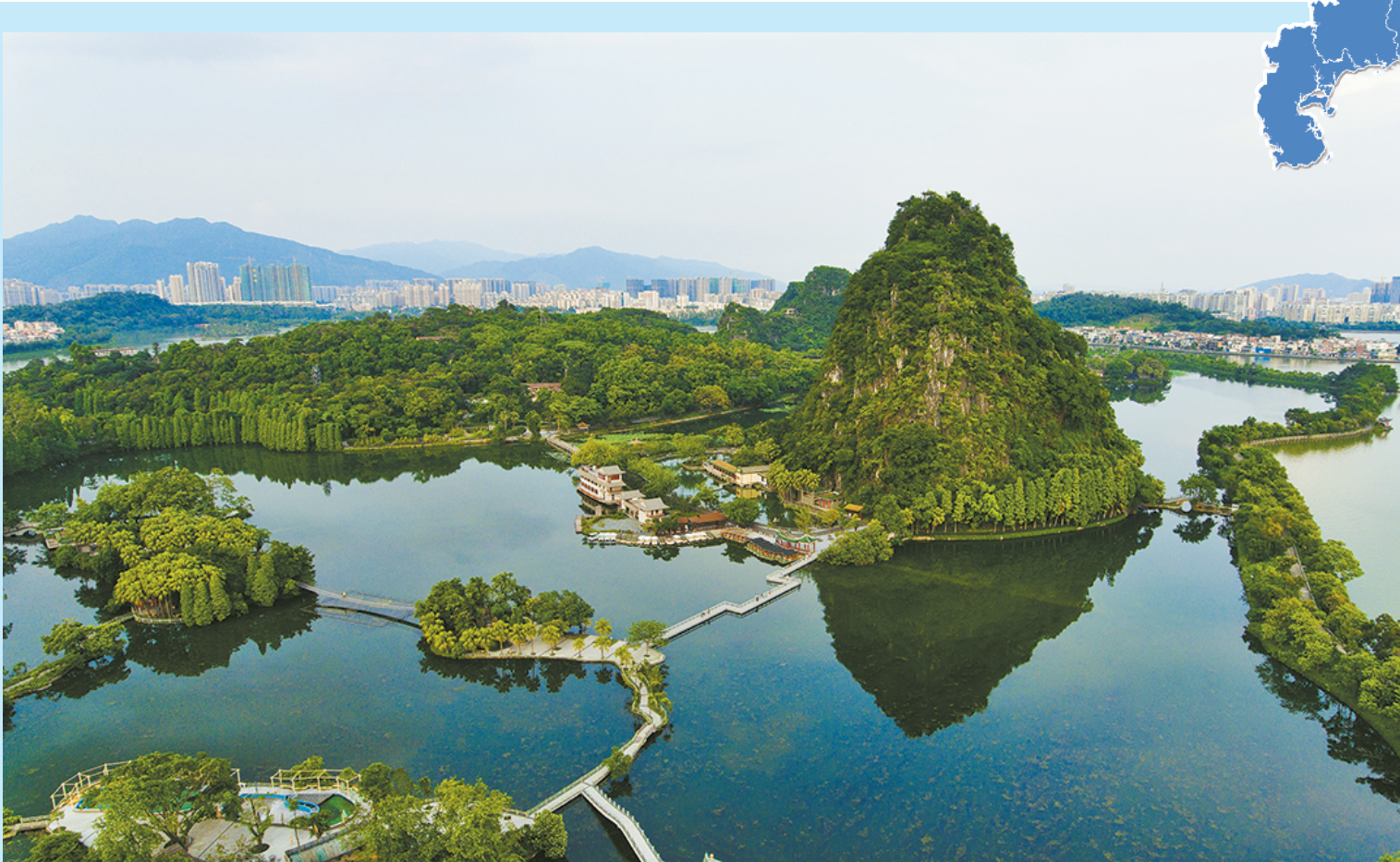
风景优美的肇庆七星岩