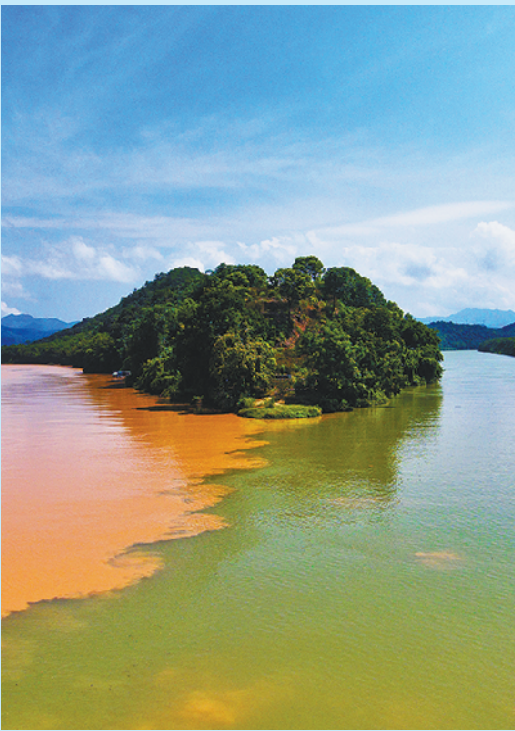
肇庆封开县贺江与东安江交汇处