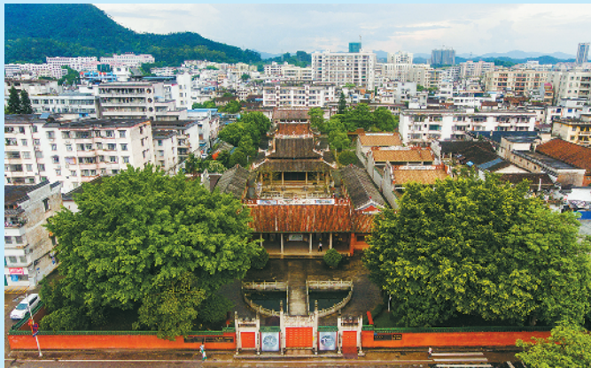
肇庆德庆县德庆学宫