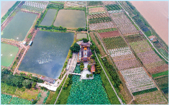
肇庆砚洲岛和岛上的包公楼，这里有包公“掷砚成洲”的故事