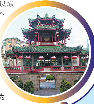
“渔楼晓角”为揭阳古八景之一

目前，揭阳滨海新区已落户一大批重大产业项目，总投资830多亿元的中石油炼化一体化及相关项目、总投资1300多亿元的海上风电项目正加快推进建设，中海油LNG项目已运营多年，国电投风电项目、明阳新能源综合基地动工建设，世界500强企业GE海上风电机组总装基地签约落地，初步形成了以炼油、石化、天然气、风电为主导的能源产业格局。