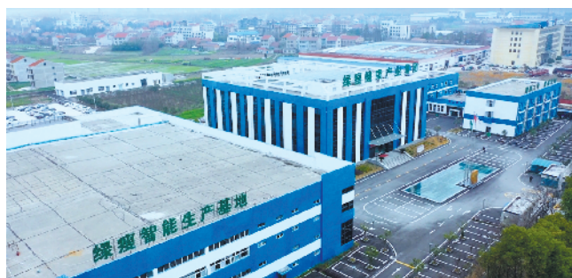
荣获广州市人民政府颁发“广州市创新标杆企业”的绿瘦集团斥巨资打造的创新型工厂——绿瘦集团湖北生产基地于今年3月正式投产，通过高技术手段实现生产流程的可视化、透明化、标准化