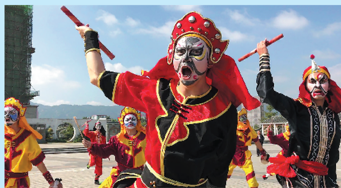
普宁英歌舞闻名海内外