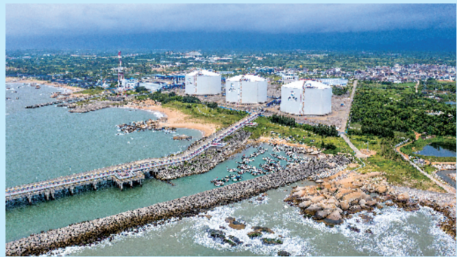
中海油粤东LNG项目，3座储罐巍然屹立