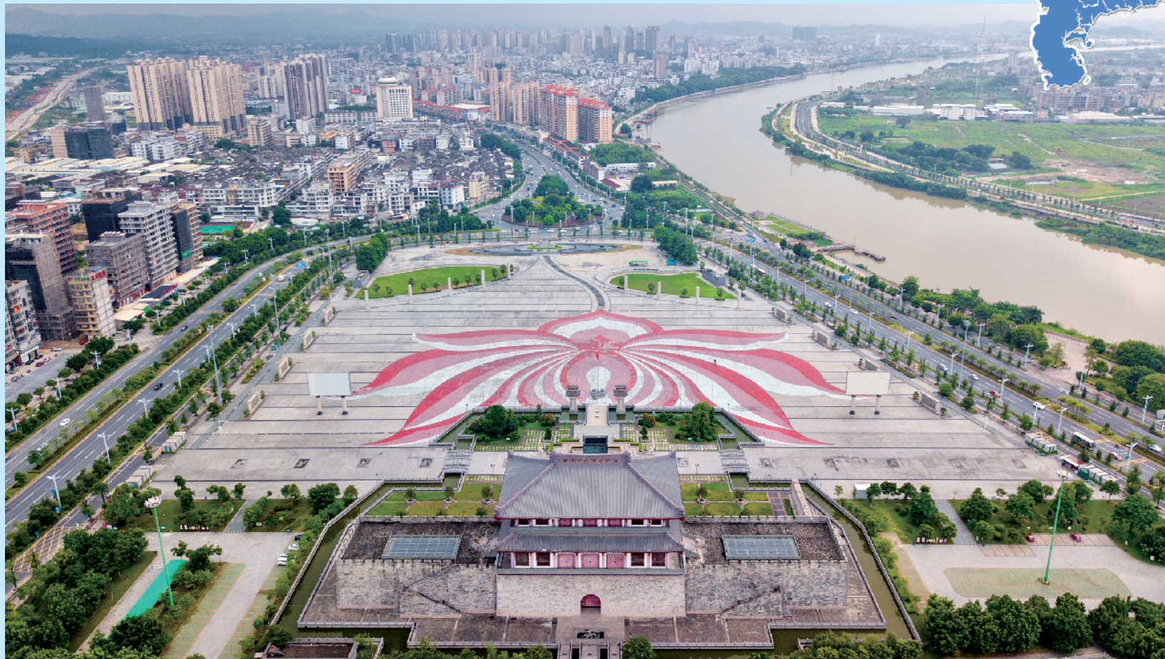
揭阳楼依榕江北河而立