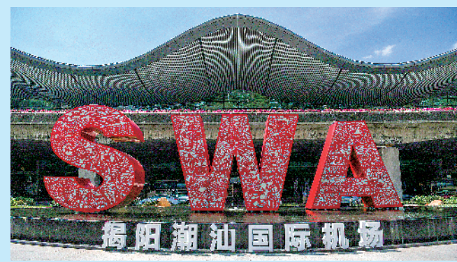
揭阳潮汕国际机场是4D级民用国际机场