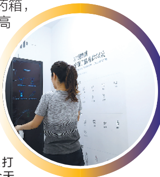
绿瘦主打AI智能的全天候健身空间

有的企业选择走“单品策略”，有的企业则选择“渠道为先”，而对于日前获得广州市人民政府颁发“广州市创新标杆企业”称号的绿瘦健康产业集团而言，则选择了“模式创新”道路。绿瘦以数据智能化为核心，采用“营养+运动+服务”的科学体重管理体系，也已形成线上线下多元业务板块商业闭环。而作为在大健康领域深耕十多年的企业，绿瘦结合自身的积累创新性地打造出“绿瘦+”战略，把围绕国民健康和美丽的诉求，分为四个层次给出解决方案——即“体重管理”“美丽管理”“慢病管理”“健康管理”。相应的，绿瘦通过向消费者提供体重管理服务、减肥训练营、智能健身房、美学馆、智慧药箱，未来还有高端医疗服务等，从不同层面帮助国民管理健康。