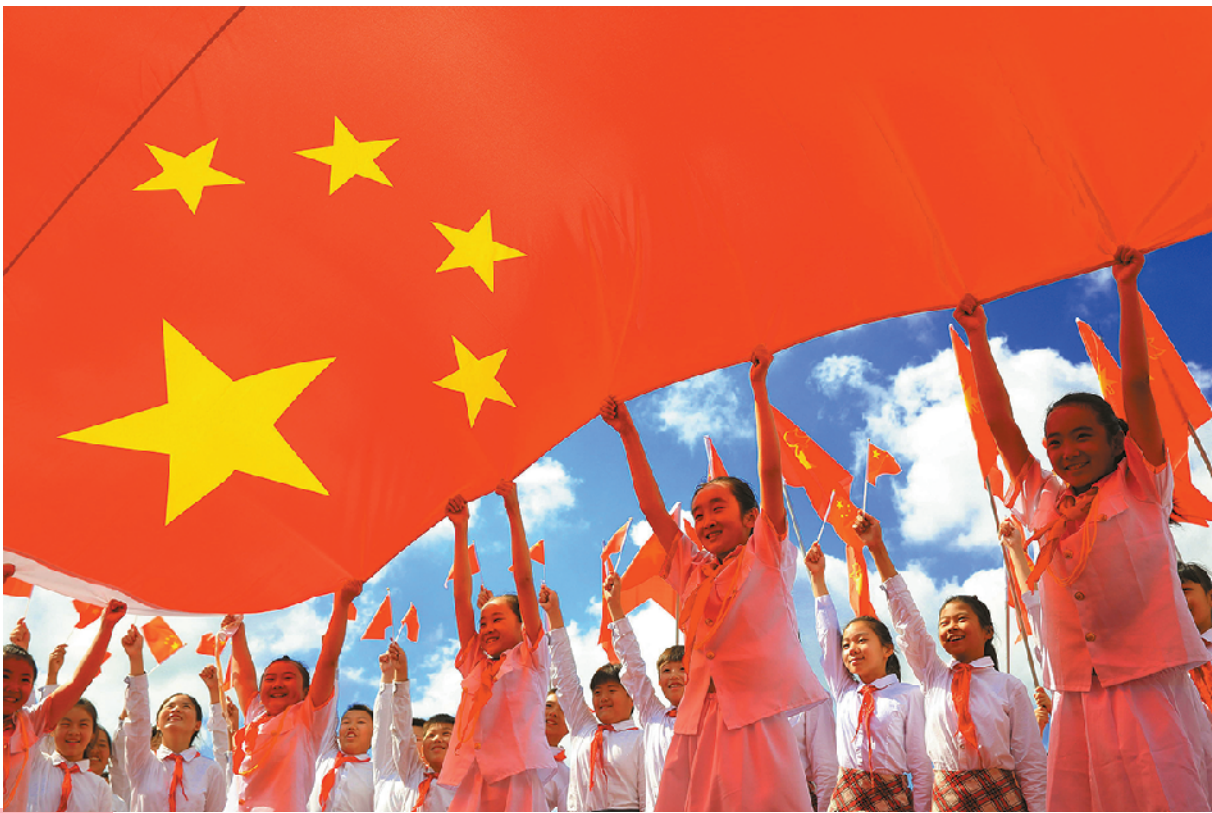
▲江苏省海安市城南实验小学学生们举起特大号国旗，喜迎国庆。

▼9月17日清晨，百名香港各界青年在金紫荆广场参加“我与国旗·金紫荆同框”活动，展示了共70面五星红旗，并高唱国歌，庆祝中华人民共和国成立70周年。参加活动的青年呼吁各界同舟共济、以爱止乱，希望香港尽快恢复秩序。