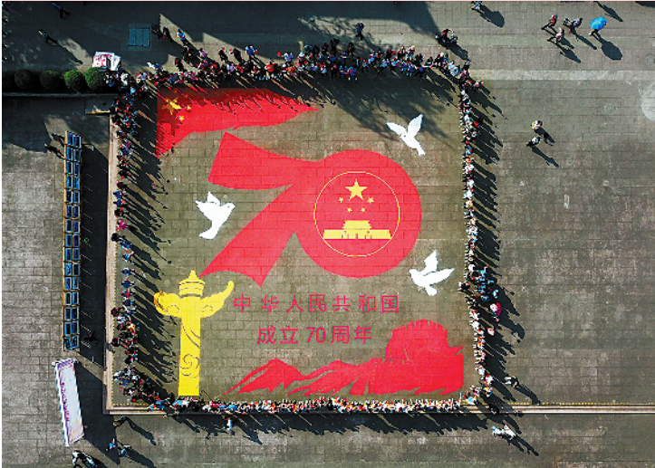
▲40位沙画团队成员和青年志愿者们在成都洛带古镇的一个广场上，耗时3小时，完成了一幅400平方米的地面沙画，喜迎国庆。