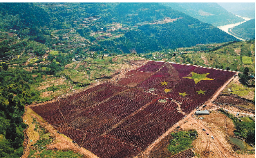
▲四川成都金堂县山岭上有一面用600万株红色鸡冠花以及数十万株金色黄菊构成的超大“五星红旗”。