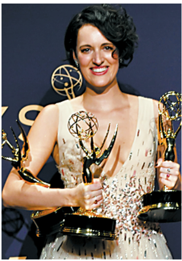
菲比成为艾美奖大赢家