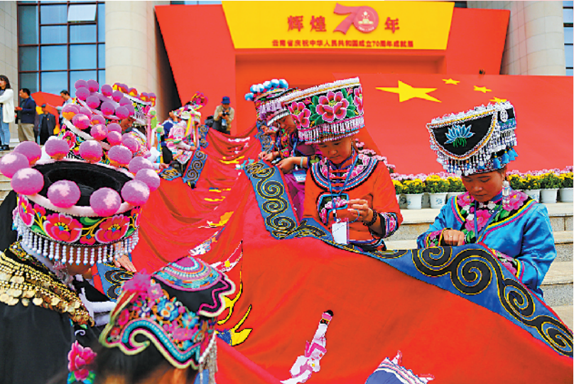
▲来自云南楚雄彝族自治州的1000多名彝族绣娘，赶在国庆前完成了一幅长70米的手绣彝族刺绣长卷“神州锦绣”，上面绣有天安门、长江、黄河等中国标志性图案。

“我和我的祖国一刻也不能分割，无论我走到哪里，都流出一首赞歌。我歌唱每一座高山，我歌唱每一条河……”为庆祝中华人民共和国成立70周年，最近走在大街小巷，到处都能听到这首《我和我的祖国》的旋律。而在微信上发起的一个“迎国庆，换新颜”的互动活动，只要在微信界面发送一条“请给我一面五星红旗@微信官方”的消息，就能让自己的头像左下方出现一面五星红旗的标志，更是让我们的手机里也呈现一片“红”。 10月1日，首都北京将举行隆重热烈的大阅兵庆祝活动。全国各地也陆续展开各种庆祝活动，国庆前后，到处已是一片红旗飘飘的盛景。