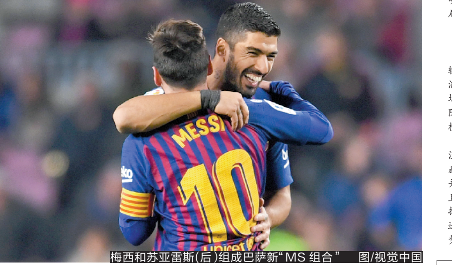
梅西和苏亚雷斯(后)组成巴萨新“MS组合”

巴萨主帅巴尔韦德在第53分钟做出调整,用智利中场比达尔换下布斯克茨,这次换人至关重要。不久前在