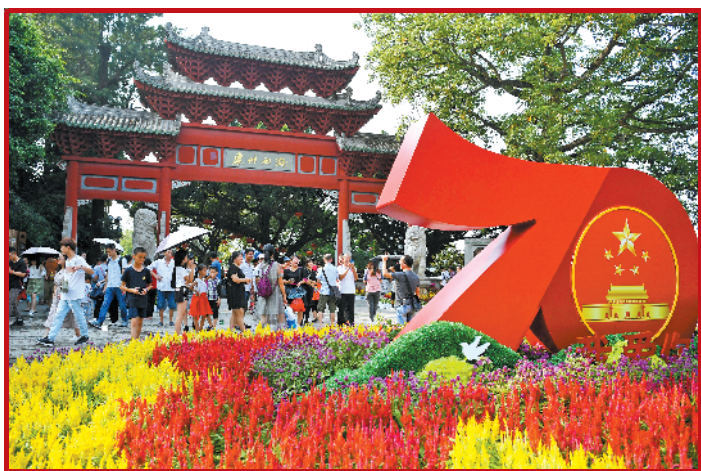
惠州，西湖景区洋溢着欢乐