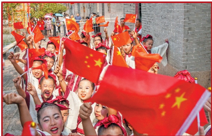
佛山，穿汉服的小孩挥舞国旗