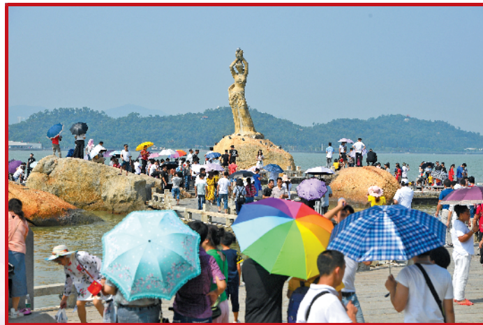
珠海，渔女景点游人如织