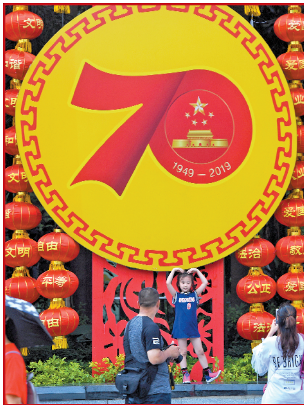
4日，广州花城广场，游客们沉浸在欢乐的国庆氛围中