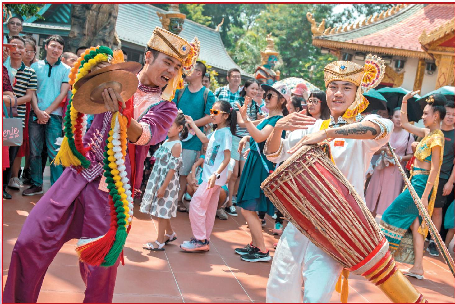
深圳，一景区举行“中华百艺盛会”国庆主题活动，多种民间艺术，呈现在游客眼前