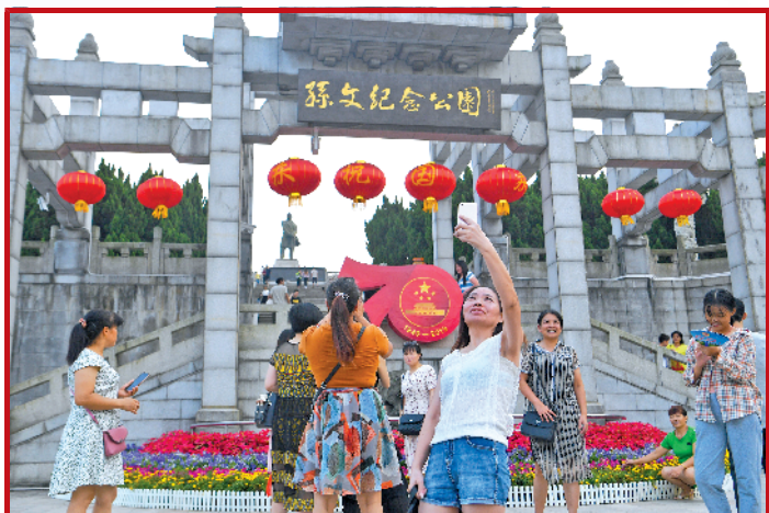
中山，孙文纪念公园，游人留影