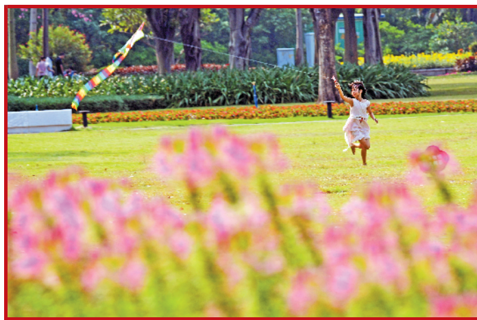
5日，广州越秀二沙岛，小朋友快乐放风筝