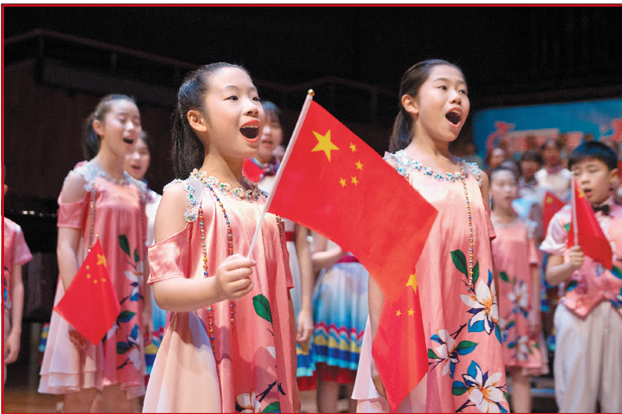
5日晚，广州小海燕合唱团演出的《海燕印象·声》音乐会在星海音乐厅举行，240名“小海燕”用悠扬的歌声唱响对祖国的真挚祝福 羊城晚报记者 黄巍俊 通讯员 罗雪莲 摄