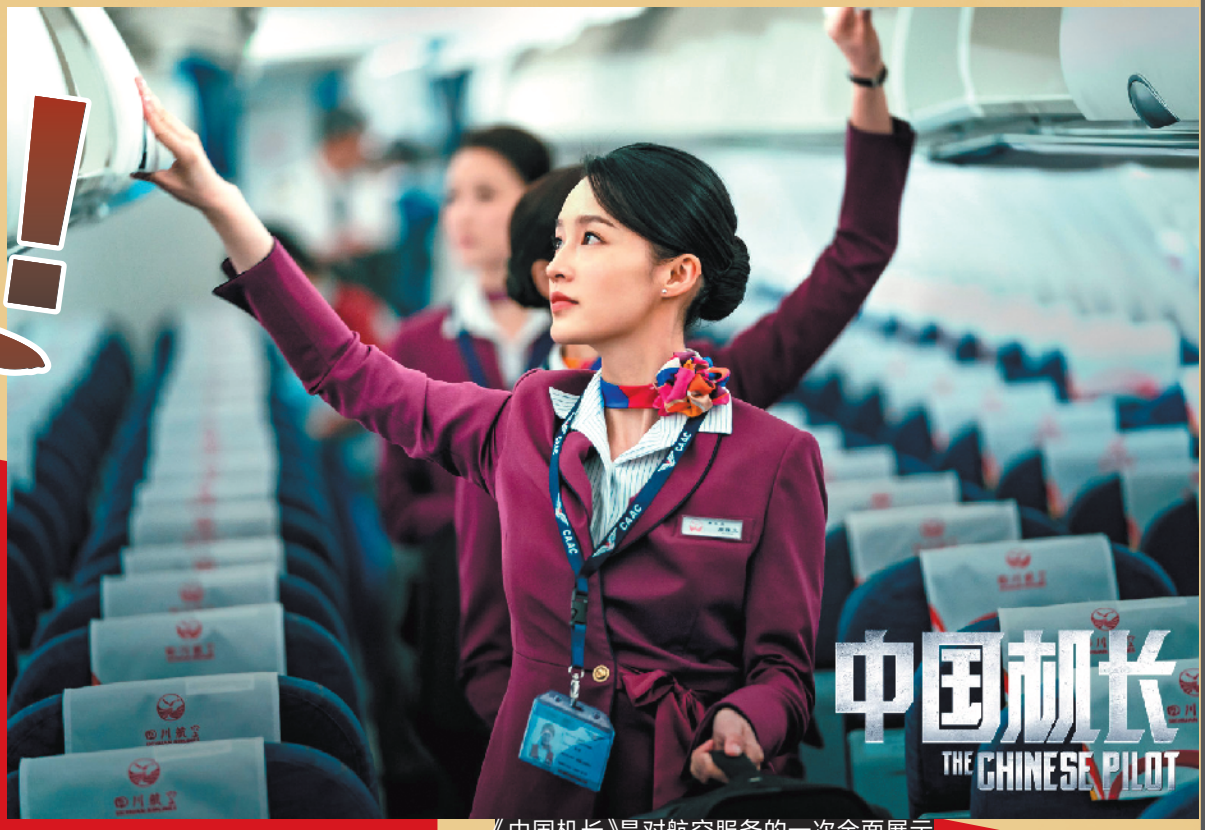
《中国机长》是对航空服务的一次全面展示

行业的重要性，同时却对老赵吹牛说自己的妻子是教师。故事最后，贾主任慕名去理发店，点名要最受群众欢迎的“三号理发师”为自己服务，过程中还对不支持服务工作的“三号理发师的丈夫”表达了猛烈的抨击。此时恰逢记者采访，“三号理发师”摘下大口罩，贾主任看到她的脸才发现是自己的妻子……影片通过“理发也是为人民服务”“新社会妇女和男人一样有平等的权利”“劳动是社会分工，还分什么高低贵贱”等台词，对当时社会上轻视服务业的不良风气、“伺候人的工作没出息”等落后思想给予了善意而尖锐的讽刺，同时也批评了当时一些人身上的仍然存留的大男子主义思想。