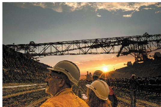
▲德国不少矿区都被转卖并重新开发，这个韦尔措露天煤矿是一个正在开发的旅游景点。画面中的游客正戴着安全帽参观矿坑。

人类对于大自然的探索总是无穷无尽的，就算已经知道诸如石油、天然气等是不可再生能源，也依然无法停止继续开发、消耗。地球上遍布各种矿坑、矿洞，有时候脑洞大开地想，这些矿洞有一天会不会挖到互通，在地表以下，出现另一个四通八达的奇妙世界——事实上，在一些科幻小说里已经有这种情景的描绘，比如《三体》中人们一度就居住在地下城。不过，如果真的有那么一天，或许地球已因千疮百孔而面临瓦解了。 人们显然也意识到这一点。关于采矿的各种限制越来越多，规定也越来越严。而很多旧矿坑在废弃后被重新修缮、利用起来，其中一个用途就是成为新的景点供人参观、游玩。 欣赏这些美景奇观时，我们应该要想到一点，这并不是自然的奇迹，而是人类活动留下的痕迹，我们究竟应该以什么样的态度来面对这些痕迹呢？