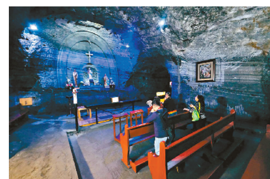
▲哥伦比亚首都波哥大附近有不少废弃矿坑都被改造成景点。一个名叫Catedral de Sal的废弃盐矿被改造成一个地下教堂，里面许多雕塑鬼斧神工，还有复杂的通道、盐钟乳石以及盐墙可显现盐矿的历史。