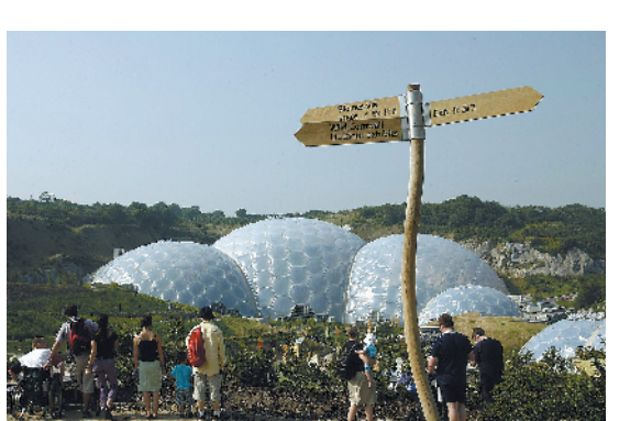
▲英格兰西南部一座废弃的粘土矿区被改造成名为“伊甸园”的植物园，2001年3月正式对外开放。这里有全球最大的温室，还有来自世界各地的数万种植物，被誉为“通往植物与人类世界的大门”。