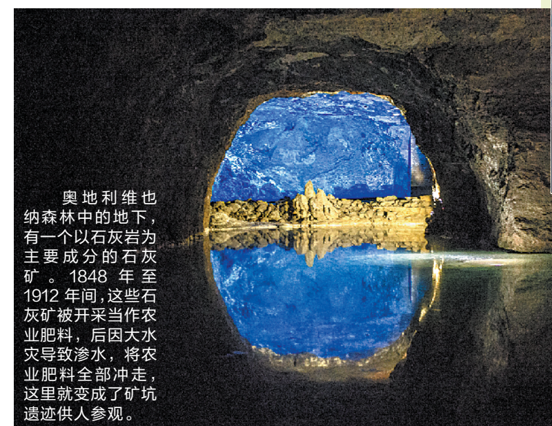
奥地利维也纳森林中的地下，有一个以石灰岩为主要成分的石灰矿。1848年至1912年间，这些石灰矿被开采当作农业肥料，后因大水灾导致渗水，将农业肥料全部冲走，这里就变成了矿坑遗址供人参观。