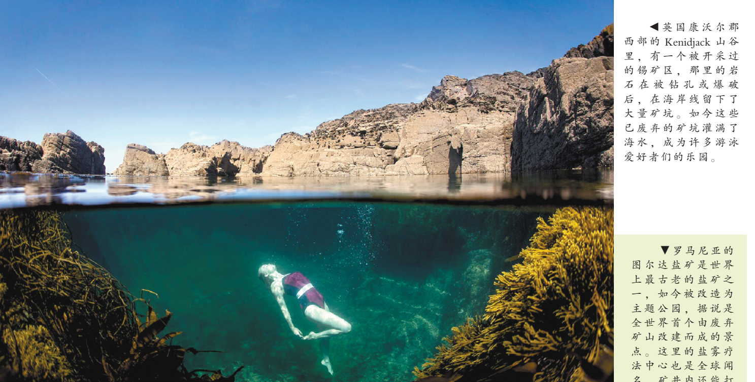
▲英国康沃尔郡西部的Kenidjack山谷里，有一个被开采过的锡矿，那里的岩石在被钻孔或爆破后，在海岸线留下了大量矿坑。如今这些已废弃的矿坑灌满了海水，成为许多游泳爱好者的乐园。