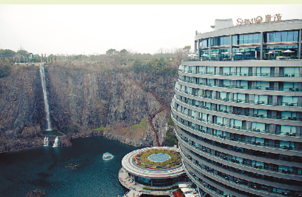
▲2018年年底开业的上海世茂深坑酒店原本是“二战”时期日军在中国建造的采石场。如今它已成为全球海拔最低的五星级酒店，入选“世界十大建筑奇迹”。