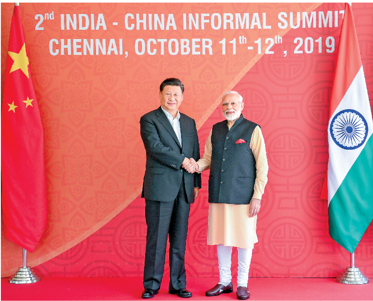
10月12日，国家主席习近平在金奈同印度总理莫迪继续举行会晤 新华社发

第三，切实提升军事安全交往合作水平。推动两军关系沿着增信释疑、友好合作的正确方向发展，开展好专业合作、联演联训等活动，持续增进两军互信，加强执法安全部门合作，维护地区安全稳定。（下转A2）