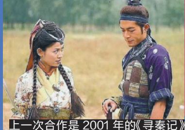
上一次合作是2001年的《寻秦记》