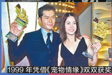
1999年凭借《宠物情缘》双双获奖

很多人都觉得古天乐不苟言笑，但这并不是宣萱眼中的古天乐：“我算是看着他入行的，见过他最开始白白的、瘦瘦的、很害羞不怎么讲话的样子，又看着他慢慢建立了自信，变得越来越有实力。”如今，古天乐已经成了电影公司老板，而两人的相处模式还跟当年在 TVB 拍戏时没啥两样。宣萱说：“我跟他讲话挺直接的，没把他当成老板。当然了，看到他忙着处理一堆事情的时候，就别去烦他了。他也从来没有跟我发过脾气。”