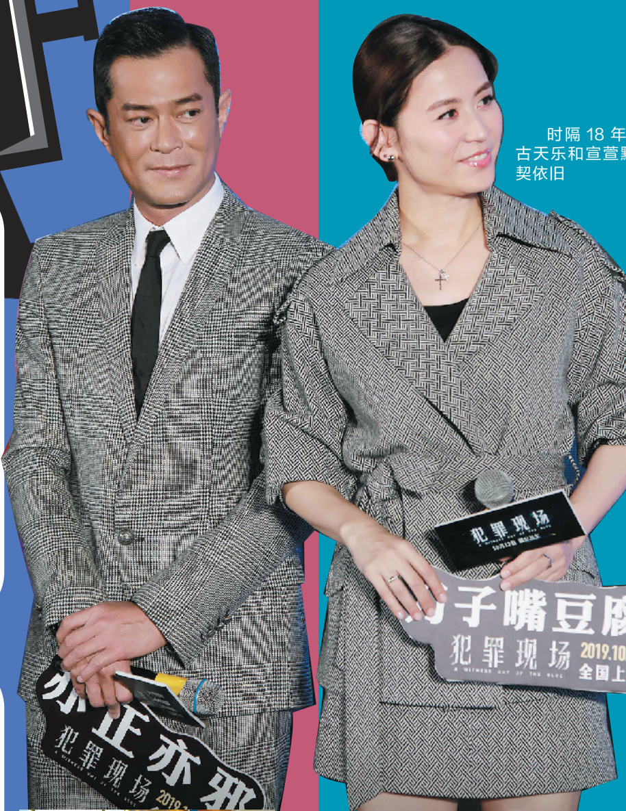
时隔18年，古天乐和宣萱默契依旧