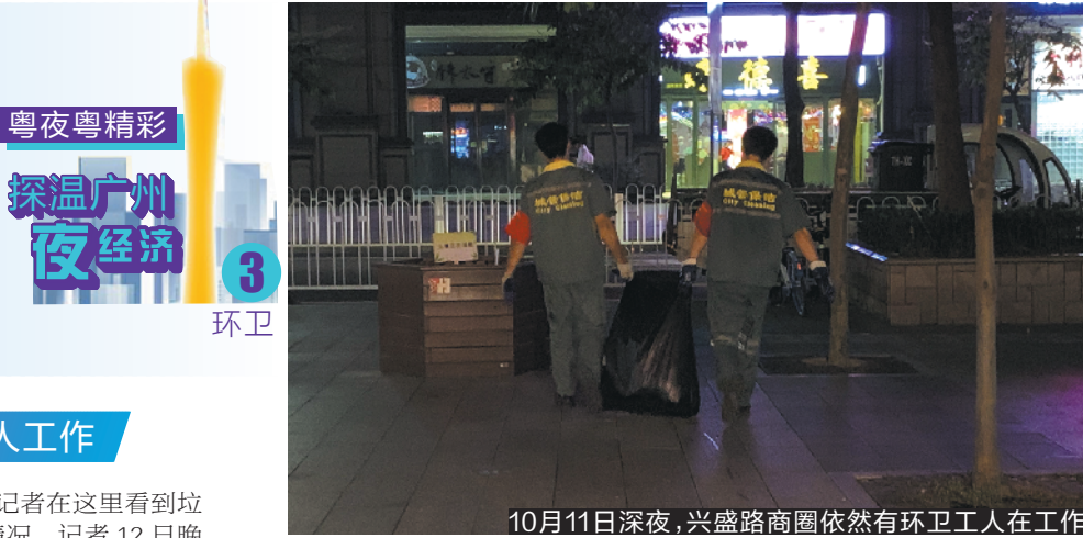
10月11日深夜，兴盛路商圈依然有环卫工人在工作

夜间经济盛行，不少城市管理工作亦相应滞后。羊城晚报记者发现，广州部分夜经济旺地开始加强夜间保洁工作，有的地方接近零时仍可见环卫工保洁。记者了解到，部分地方夜间保洁加强和此前羊城晚报“走马广州夜经济”系列报道有关。