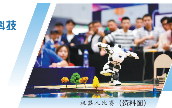
机器人比赛(资料图)

三大通信巨头于今年6月成为首批获得工信部发放5G商用牌照的企业,他们都将带来5G方面的最新技术应用。中国电信将展示其5G业务、