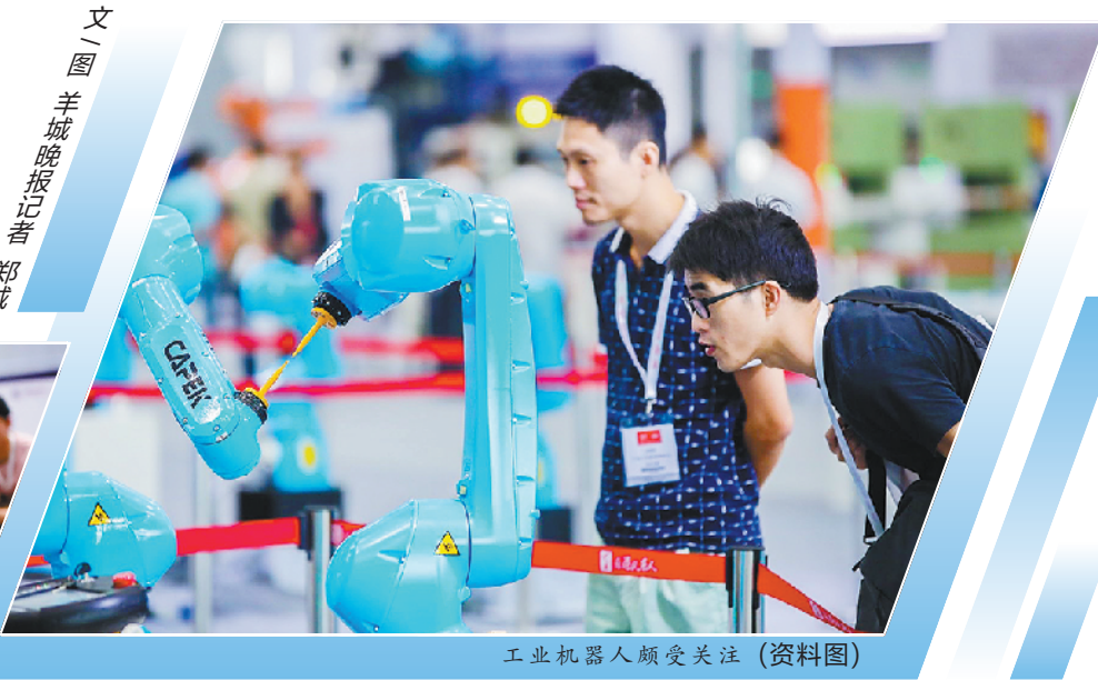
工业机器人颇受关注(资料图)

围绕“智慧联通,遇见美好未来”主题,聚焦5G前沿技术、数字政务和工业互联网,通过应用场景、落地案例及互动体验等多种方式进行展示,全面体现中国联通在惠民、惠政、惠业方面的赋能,特别是在5GAR教育、5G多路互动直播、智慧城市建设等多方面的创新能力。