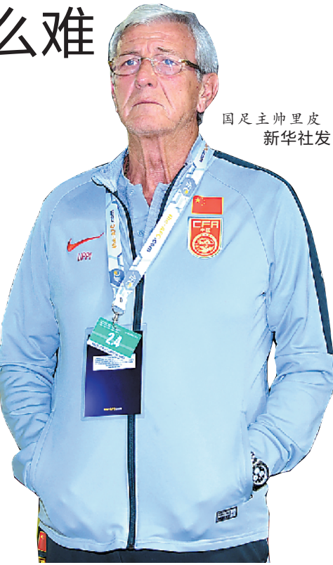
国足主帅里皮

育·足彩大富翁》报(电子版:www.okdfw.com, 微信公众号:穗城sports、羊体加官微)周五刊认为,如今广州恒大陷入“国队入—中超—亚冠”三线噩梦,周末对阵“升班马”深圳佳兆业难言稳胜。(钟韵)