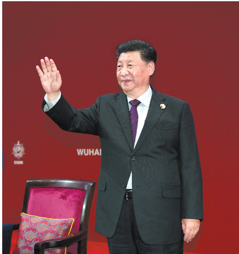
18日，中共中央总书记、国家主席、中央军委主席习近平在武汉出席第七届世界军人运动会开幕式并宣布运动会开幕