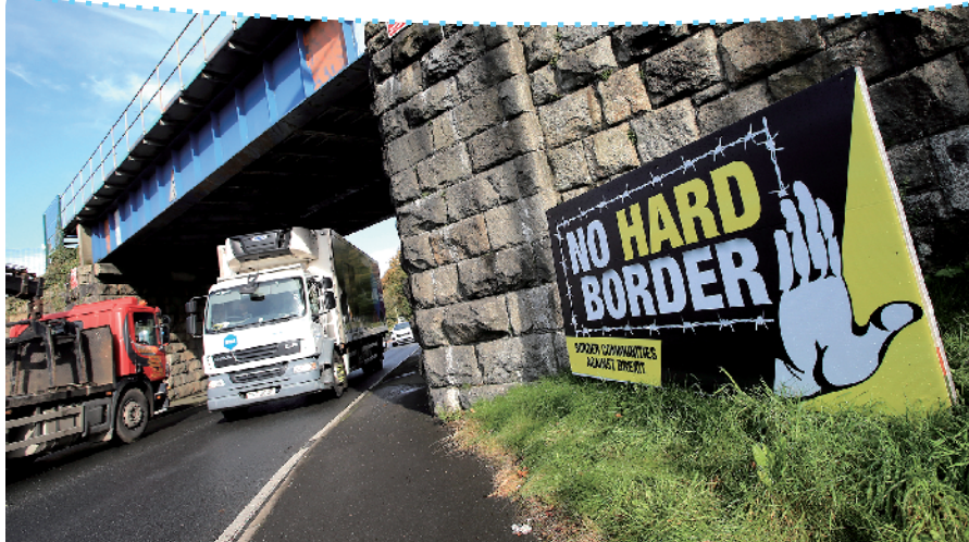
18日,英国北爱尔兰与爱尔兰边界附近竖立着一个反对“脱欧”的标语牌

西班牙看守政府首相桑切斯同日表示,骚乱会给经济和社会带来严重后果,政府不会让暴乱分子逍遥法外,可能会采取措施平息骚乱。(新华社)