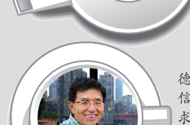
胡泳 北京大学新闻与传播学院教授