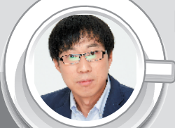
曹林 北京时事评论员