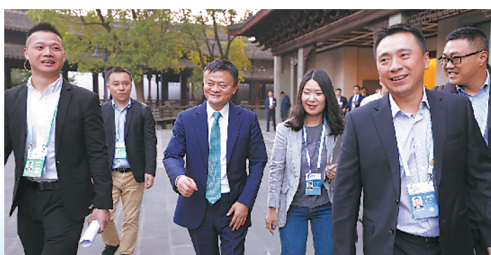
马云现身乌镇西栅景区,参加第六届世界互联网大会

这15项成果是鲲鹏920处理器、面向通用人工智能的异构融合芯片、统一自然语言预训练模型与机器阅读理解、360全视之眼、Oday漏洞雷达系统、特斯拉完全自动驾驶芯片、飞桨深度学习平台、POLARDB:基于存储计算分离与分布式共享存储架构的云原生数据库、思元270芯片、科技向善——通过科技手段助力现代智慧城市综合治理实践、人工智能算法平台Brain++、硅立方漫浸液冷却计算机、IPv6大规模部署实践与技术创新、Versal自适应计算加速平台、民用飞机制造5G创新示范应用。