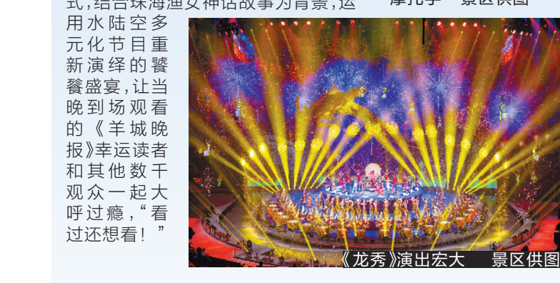
《龙秀》惊险刺激的“摩托手”

国庆长假刚过，19日晚，《羊城晚报》邀请幸运读者到珠海长隆剧院，一起免费享受倾力巨献中国风神话故事原创大秀——《龙秀》带来的视觉盛宴。