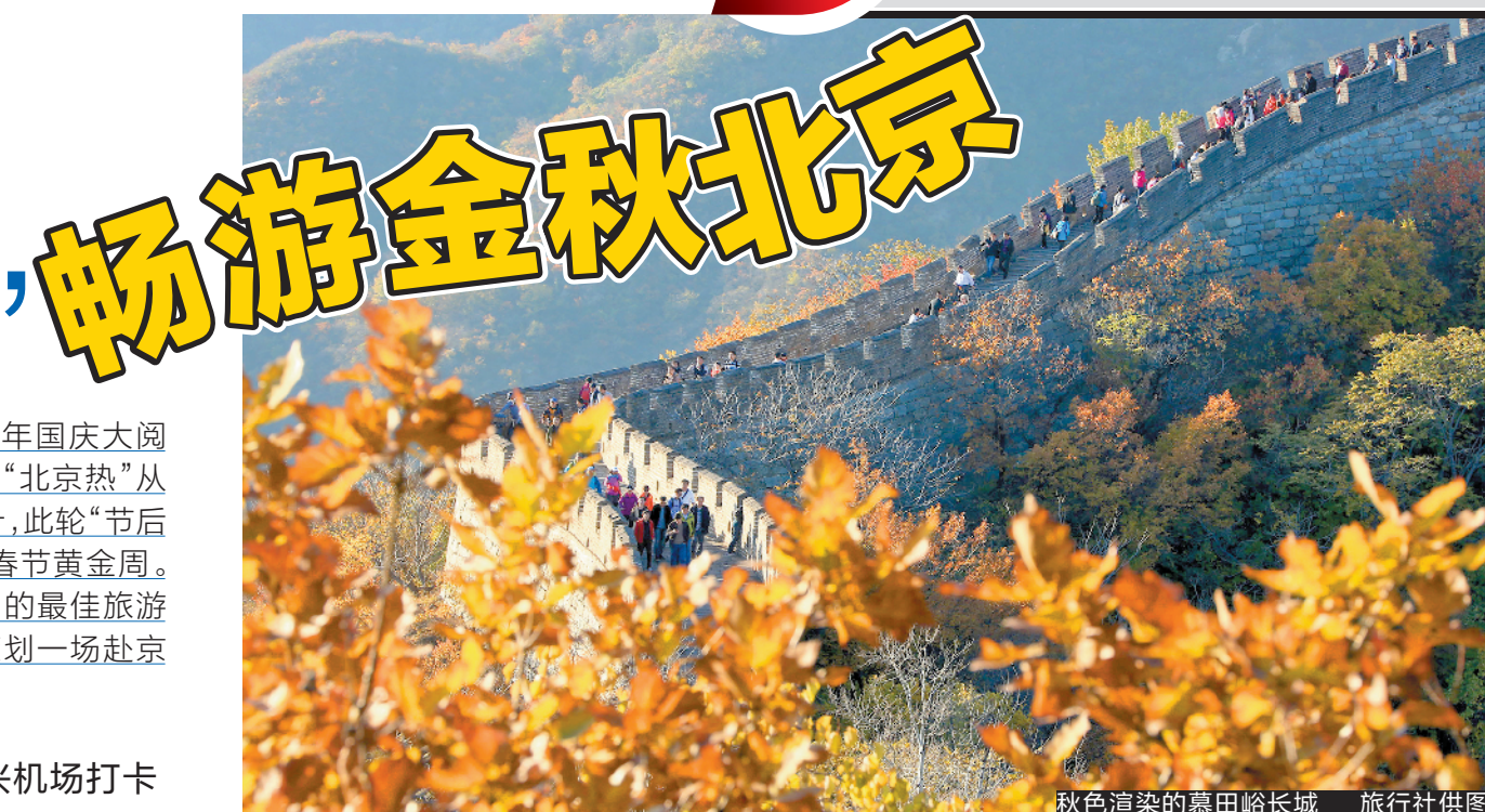
秋色渲染的慕田峪长城