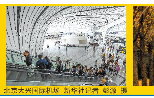
北京大兴国际机场

据了解，国庆大阅兵叠加被誉为“新世界七大奇迹”之首的北京大兴机场开放，使得原本就是秋游热门目的地的北京迎来“史上最火秋游季”。