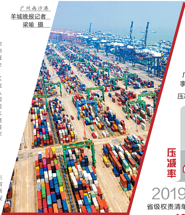
广州南沙港

一年来，广东牢记总书记嘱托，抓住机遇、迎接挑战、不负重托，以新担当新作为持续深入推进改革开放，结出了丰硕成果。