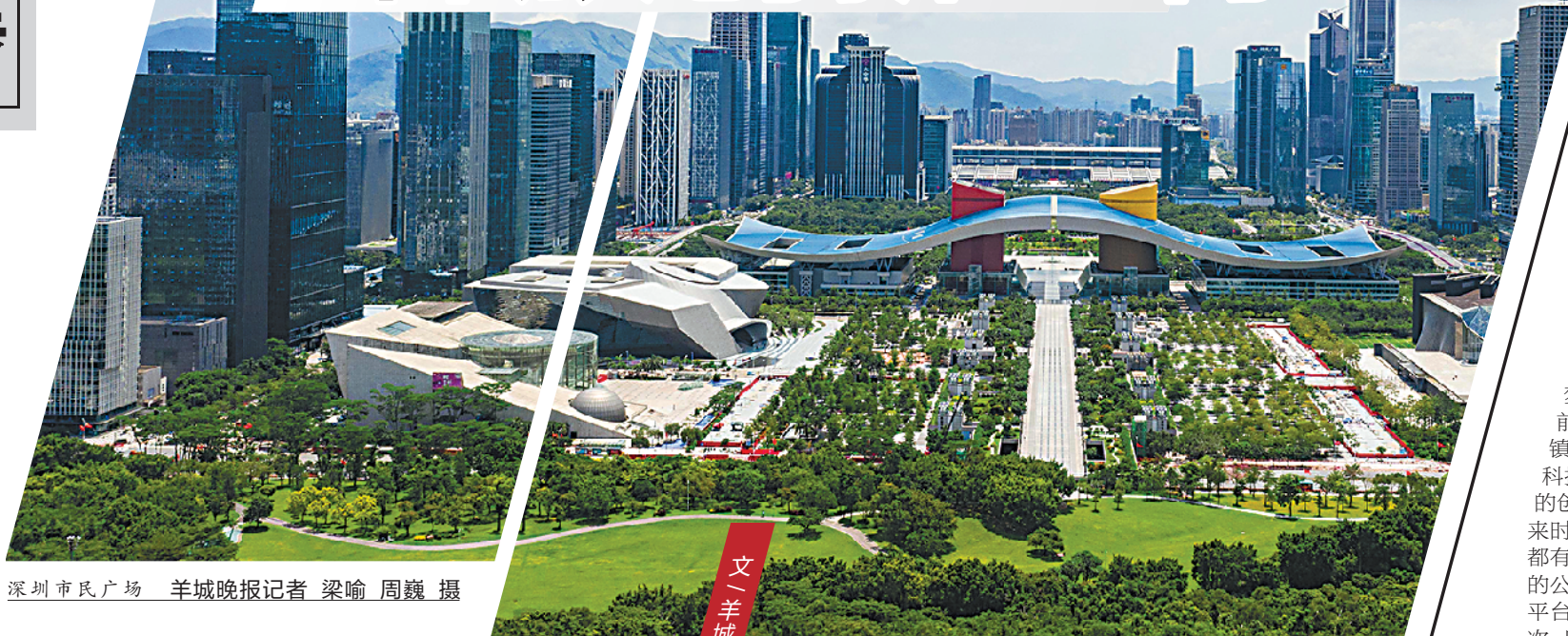
深圳市民广场