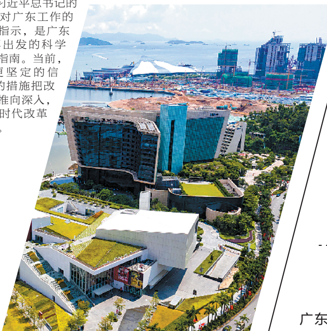
深圳蛇口

改革开放，是广东发展的根和魂。习近平总书记的重要讲话及对广东工作的一系列重要指示，是广东改革开放再出发的科学指引和行动指南。当前，广东正以更坚定的信心、更有力的措施把改革开放不断推向深入，继续走在新时代改革开放的前列。