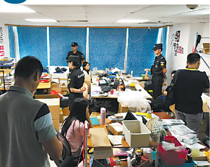
专案组展开收网行动

侵权产品。经调查摸底，侵权产品由位于深圳市、东莞市和汕尾市的6个生产窝点提供，并由位于深圳的两个全国总仓库发往全国各地维修点，涉及全国10个省市共37个城市的70余个维修点。